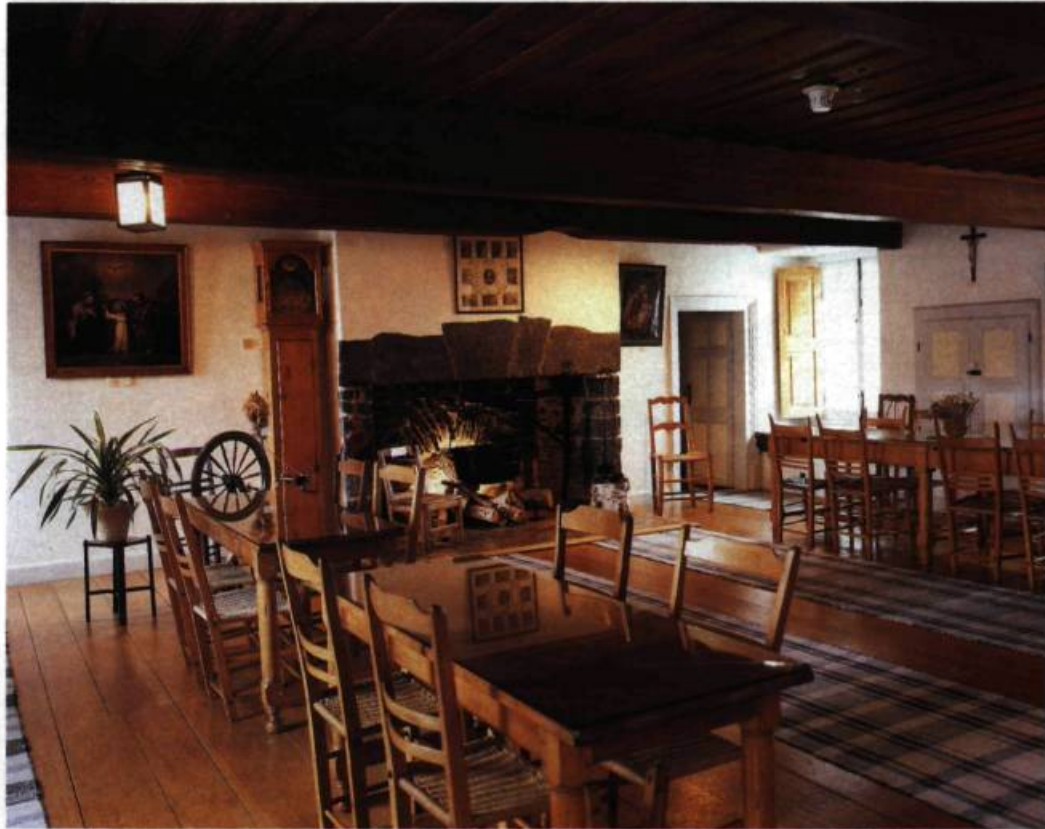
Dans la salle commune, à la fois réfectoire et salle de réception, les nombreux meubles de pin contribuent à créer une atmosphère chaleureuse où le temps semble s'être arrêté.

Place Dublin, à la Pointe-Saint-Charles, dans un environnement des plus urbains, s'élève un imposant bâtiment de pierres des champs noyées dans un épais mortier. Vestige d'une autre époque, la Maison Saint-Gabriel 1 est l'une des rares constructions qui témoignent de l'architecture montréalaise de la fin du XVII e siècle. Érigée vers 1668 par François LeBer et acquise peu de temps après par Marguerite Bourgeoys, fondatrice de la congrégation de Notre-Dame, cette maison de ferme, reconstruite en 1698 après un incendie, constitue aujourd'hui un site unique.