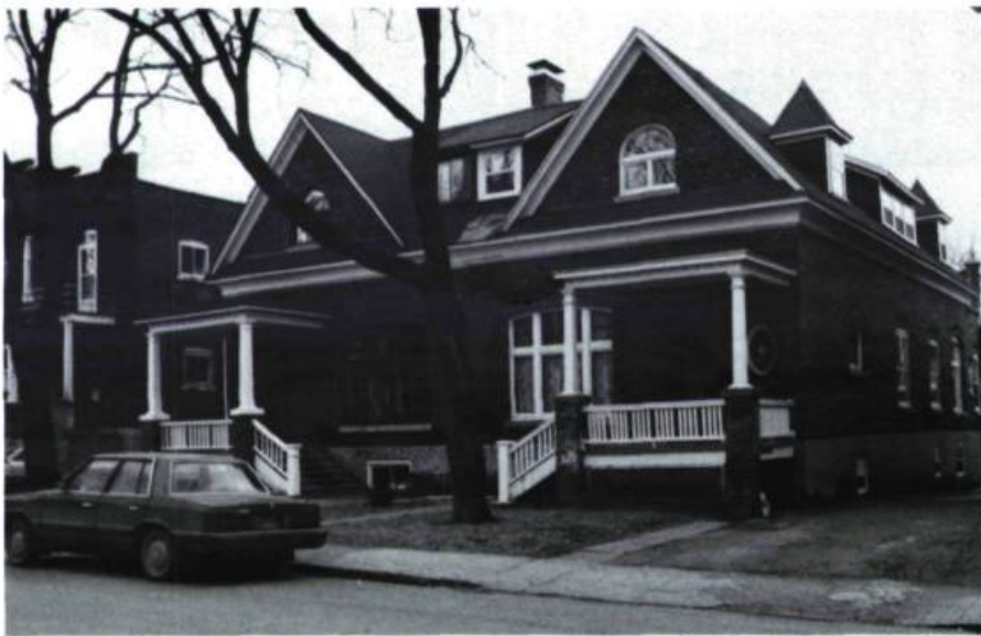
Maison P. Guidazio, 327, Querbes (1912).

Vers le nord (7), il faut absolument voir sur l'avenue Bloomfield les 12 cottages qui s'étendent entre les numéros 474 et 520 et rivalisent de luxe ou d'originalité pour ce qui est du décor. Construits en série la même année pour le même client et par le même architecte, ils reprennent essentiellement le même parti, mais le traitement de la façade est sans cesse renouvelé au point qu'ils apparaissent parfaitement individualisés. Seule leur commune exubérance ornementale peut mettre la puce à l'oreille (maisons B. Damien; J.-A. Godin, arch.; 1912).