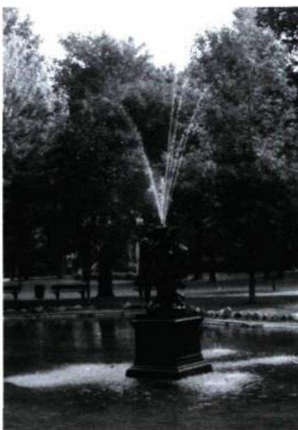
Fontaine du bassin McDougall (1916), dans le parc Outremont, inspirée par les Groupes d'enfants qui ornent le parterre d'eau du château de Versailles.

Ceux qui s'avanceront avenue Champagneur (5) pourront découvrir une jolie paire d'habitations exceptionnellement réunies par une arche chevauchant l'allée des voitures (n° 420 et 426; maisons de M me A. Roy; J.-A.-S. Houle, arch.; 1936), une série de dix maisons jumelées présentant d'étonnantes colonnes ioniques en béton (n° 430 à 494, construites pour L.-A. Beauchemin; concepteur inconnu; 1919-1920), de très sympathiques cottages jumelés traités à la manière de bungalows dont il faut observer