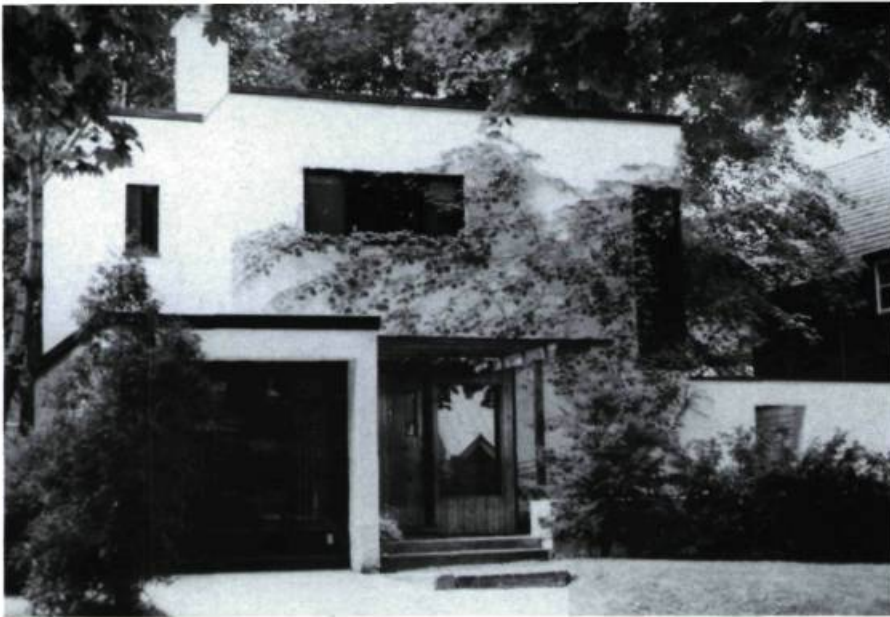
Maison A.-L. Gravel, 268, McDougall (W. Ralston, arch.; 1936).

motif de feuilles d'acanthé (résidence P. Guidazio; concepteur inconnu; 1912) et la dernière pour son entrée et son balcon enfoncés, sa forte corniche à modillons et le grand arc qui couronne la travée du salon (maison Georges Vaillancourt; concepteur inconnu; 1911).