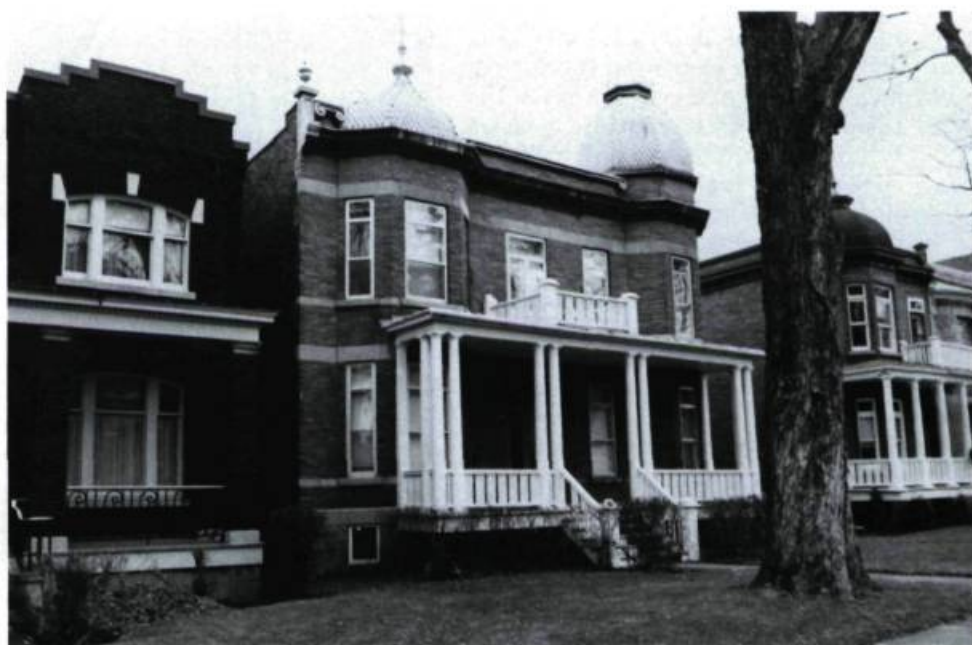
Le 221, Outremont (A.-H. Lapierre, arch.; 1908).

Ce circuit propose de visiter le quartier qui s'étend à l'est de l'avenue Outremont, du chemin de la Côte-Sainte-Catherine et de l'avenue Fairmount au sud à l'avenue Bernard au nord. Ce secteur se partage en maisons unifamiliales et bifamiliales, de part et d'autre de l'avenue Saint-Viateur. Il comprend aussi des bâtiments institutionnels, commerciaux et multifonctionnels remarquables, comme les installations des clercs de Saint-Viateur et la bande d'édifices limitrophes le long de l'avenue Bernard.