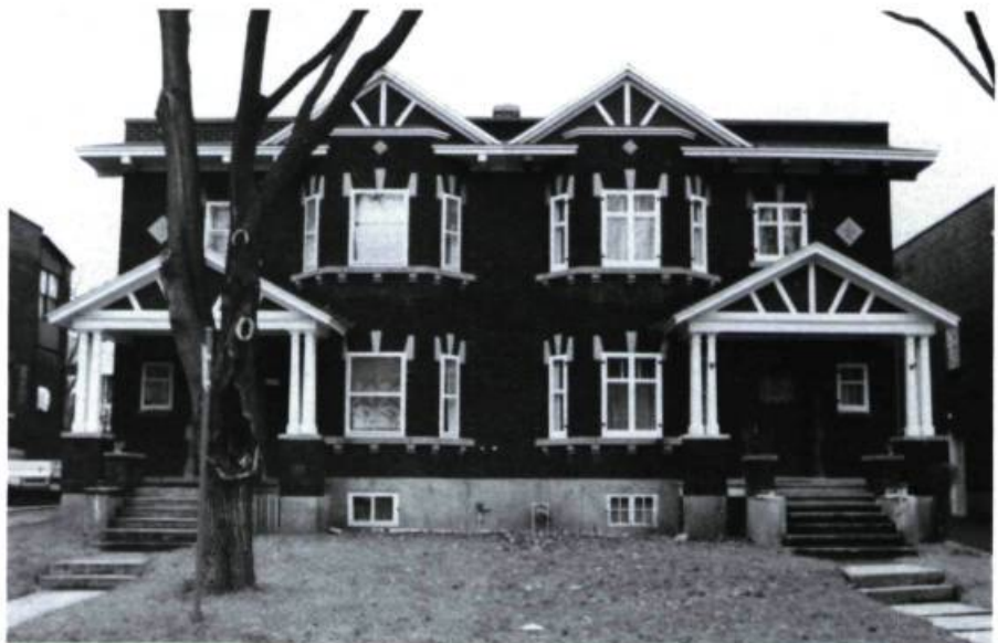
Maisons J. E. Wilder, 866-870, Hartland (J.-H. Noël, dessinateur; 1924).