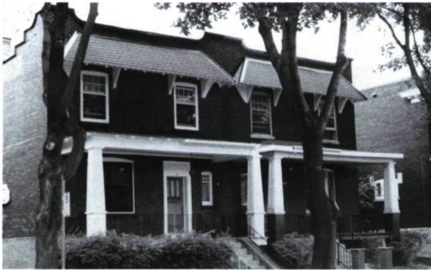
Jumelé, 776-778, Hartland (1925).

Plus intéressants que les éventuels procédés déloyaux entre collègues ou les façons de rentabiliser son travail en l'appropriant de diverses manières, on retiendra l'habileté qu'il y a à reprendre une formule heureuse sans tomber dans l'exacte et monotone répétition, et l'harmonie qui en a résulté pour la ville, où nombre de bâtiments sont apparentés par le rythme de leur composition sinon par la similitude de leurs formes. Dispersés sur le territoire, ils renvoient les uns aux autres sans que l'on s'en rende compte et créent une familiarité qui n'est pas étrangère au bien-être.