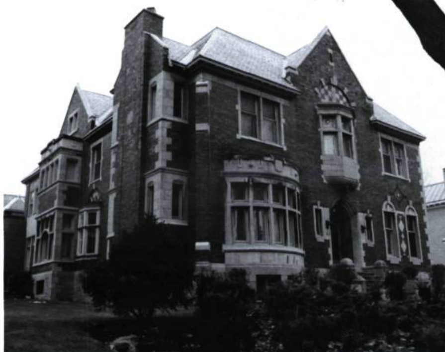
Maison Rodolphe Tourville, 22, Ainslie (Turner & Carless, arch.; 1914).