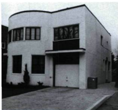
Maison J.-B. Beaudry-Leman, 7, Ainslie (M. Parizeau, arch.; 1936).