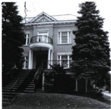
Maison F. Guérin, 26, Ainslie (Z. Trudel, arch.; 1912).