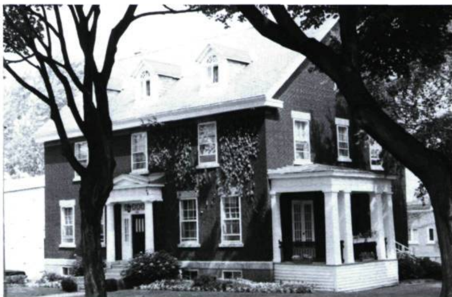
Maison E. Gravel, 545, Davaar (Perrault & Gadbois, arch.; 1921).

arch.; 1922). Plus près de l'avenue Van Horne, sur le même côté, une série de trois duplex marqués par l'Art déco, l'un dans sa conception générale, les autres essentiellement au niveau du décor, malheureusement perdu en partie (n os 753 à 759; R. Boilard, arch.; 1931 et n os 761-763; M. M. Kalman, arch.; 1933).