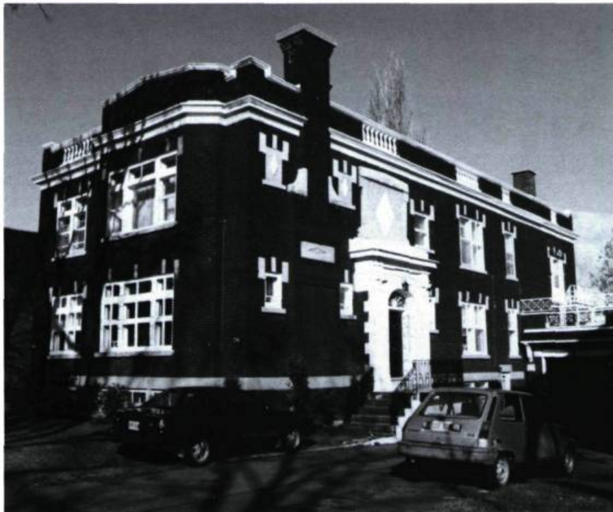
Maisons Beauregard et Labelle, 735-737, Davaar (R. Gariépy, arch.; 1922).

628-630 témoigne d'une intéressante recherche d'unité transcendant leur dualité fondamentale, au niveau de la continuité des fines galeries ioniques, du bandeau de pierre et de la frise de brique qui les surmontent (maisons Laurent & Frère; S. Frappier, arch.; 1913). Dans un autre esprit qui rappelle certains quartiers de Londres, celles qui vont du 580 au 592 (maisons J. Ducharme; L. Parent, arch.; 1926) illustrent un parti autrement inusité à Outremont qui est de reconnaître les garages comme parties intégrantes de l'habitation moderne et de les présenter de plain-pied en façade. La noble corniche qui surmonte encore le garage du 592 et les belles portes dont le 580 donne toujours le modèle révèlent la distinction originelle de l'ensemble.