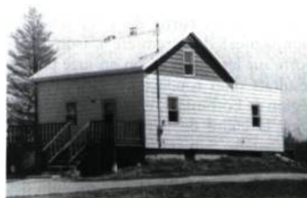
3.-4. Deux manières bien différentes de traiter l'intégration d'une annexe. Dans un cas, le nouveau volume est légèrement en retrait et délimité par des planches cornières; l'utilisation du bardeau comme revêtement assure à cet ajout une intégration harmonieuse. Dans l'autre cas, on a opté pour un matériau tout à fait différent et créé un déséquilibre volumétrique.