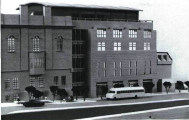
Les plans du Musée McCord ont valu au projet le Prix d'excellence en architecture 1989. Ils ont été conçus par le consortium JLP et Associés/LeMoyné, Lapointé, Magne, architectes.

sons financières, ne pouvait en assurer le développement, il est devenu autonome en 1988. Cependant le terrain, le bâtiment et les collections demeureront la propriété de McGill pendant 99 ans. La gestion du Musée se fait néanmoins séparément. Le mandat qu'on m'a confié comprend ainsi deux volets: il s'agit d'abord de mener à terme la construction de l'édifice et de préparer les expositions; puis il faut s'employer à consolider la vocation publique du Musée, bien qu'en fait il ait toujours été ouvert à tous.