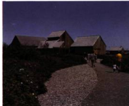
Les bâtiments modernes construits dans le parc respectent eux aussi, par leurs formes, le thème de «l'harmonie entre l'homme, la terre et la mer».

La ferme Blanchette, un établissement agricole typique, procure au visiteur les dimensions humaine et historique qui manquent souvent aux autres parcs nationaux.