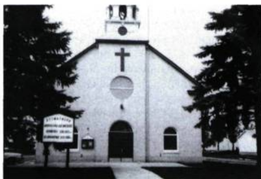
La modeste église Saint-Mathieu, construite en 1921-1922.

Le seul ensemble de vitraux classés historiques au Québec.