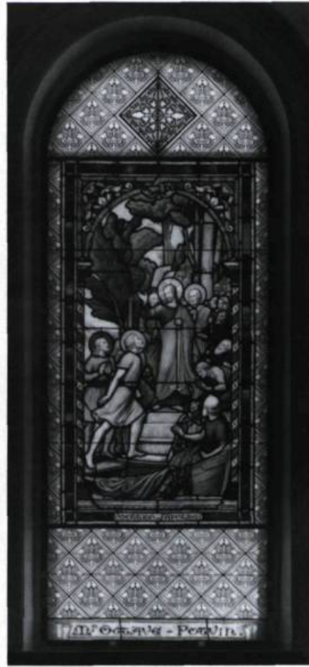
La présence de thèmes chers aux confessions protestantes démontre qu'il s'agit bien de vitraux récupérés. La vocation des apôtres, daté du début du XX e siècle, est attribué à l'atelier O'Shea.

vitrail-tableau; l'utilisation rationnelle des plombs et de toutes les techniques de peinture sur verre le confirme, tout comme l'emploi d'éléments architecturaux de différentes époques. Ces cadres permettaient aux verriers de composer des tableaux de verre, peu importe le style de l'église.