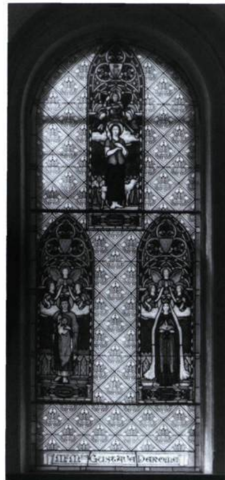
Exemple éloquent de la manière dont on a adapté, en 1937, les vitraux anciens à la fenêtre de l'église. Les trois petits vitraux attribués à la compagnie Vermonet représentent saint Louis, sainte Jeanne d'Arc et sainte Jeanne de Valois (v. 1890-1907).

Les verrières de Saint-Mathieu présentent, il est vrai, suffisamment de caractéristiques pour commander leur conservation. De dimensions différentes, mais tous adaptés au fenêtrage de l'église au moyen de grisailles, les douze vitraux constituent un ensemble à ce point hétéroclite sur le plan de l'iconographie, de la composition et de la peinture du verre, qu'il s'agit presque d'un survol de l'art du vitrail tel que pratiqué au Québec dans la première moitié du XX e siècle.