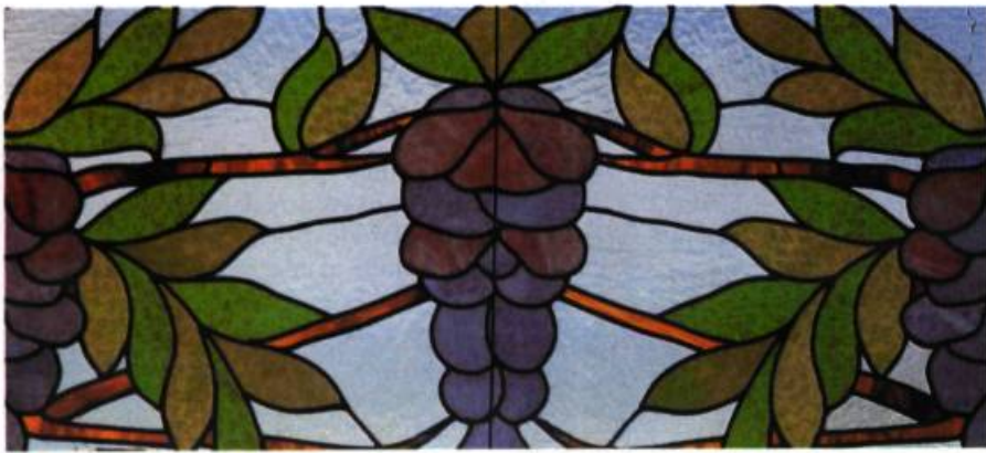
Ce vitrail à décor de glycines, choisi dans le catalogue Hobbs publié vers 1915, coûtait 3,60$ le pied carré.