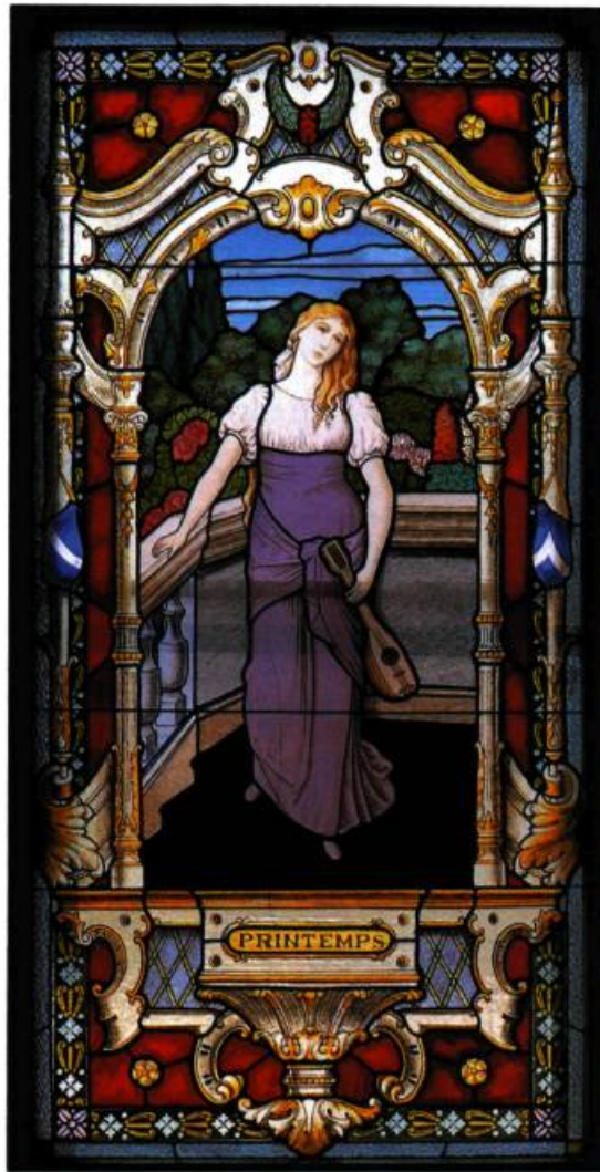
Vitrail éclairant la cage d'escalier d'une maison familiale, commandé chez Hobbs vers 1915.