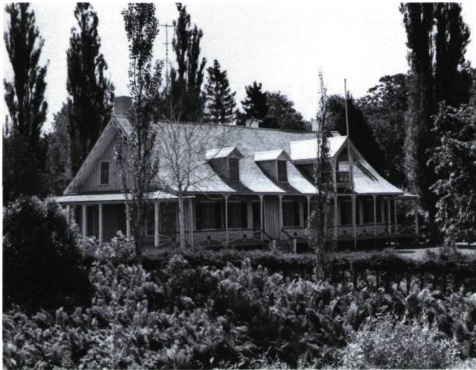
À Leclercville, dans Lotbinière, l'ancien bureau seigneurial où vit toujours la famille Joly de Lotbinière.