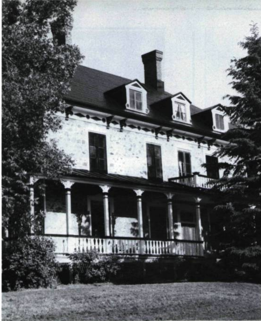
Le manoir de Saint-Ours: le calme et la sérénité du seul domaine seigneurial québécois encore occupé par les descendants en ligne directe du premier seigneur.