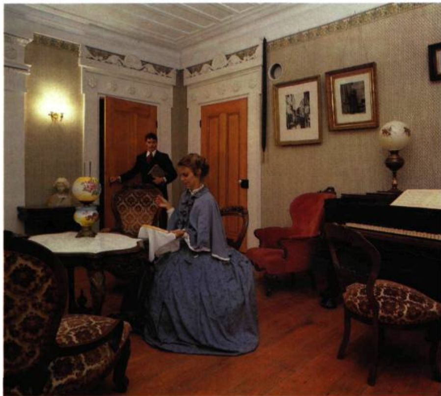
Pour certaines pièces du manoir, on a privilégié la reconstitution d'époque tout en évitant le piège de la surcharge et du côté statique.