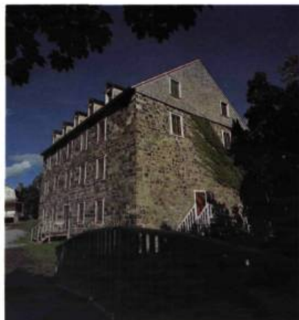
Le moulin actuel, le troisième depuis la concession de la seigneurie, a été construit en 1842. On y moule toujours les céréales pour la farine.

Le site parle de lui-même, on le laisse vivre. Quel bonheur alors pour le visiteur vacancier de pouvoir jouir de l'endroit sans contraintes. Pas de parcours obligatoire, pas d'«accès interdit». On peut y pique-niquer, se promener dans la pinède, s'arrêter au jardin, décider d'entrer au manoir ou au moulin. Le visiteur ayant droit à son propre rythme, l'osmose entre lui et le site est quasi automatique. Aux Aulnaies, l'odeur de la farine vient renforcer l'idée qu'on se fait du moulin, et elle s'impose ensuite comme déclencheur d'une mémoire qui vaut bien les mille mots d'interprétation. Le ronronnement des courroies de la grande roue à godets remplace avantageusement l'«audio-guide». L'enseignement se fait sur demande et en douce, parfois au hasard d'une rencontre avec le guide-interprète qui se promène en costume d'époque dans un des sentiers du domaine. Une conversation avec la «seigneuresse-guide» actualise l'histoire. Voilà une formule personnalisée qui cadre bien avec l'esprit des vacances.