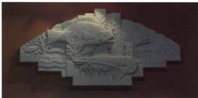
Un des bas-reliefs réalisés par le sculpteur français Denis Gélin.

La salle à manger, une vaste nef scandée par des piliers de marbre importé de France, est inspirée de celle qu'a créée Pierre Patou sur le paquebot Île-de-France (1927). Extrêmement raffinée, l'harmonie en rose, gris et beige est caractéristique du style Art déco. Éclairée de verrières translucides soulignées de noir et arrondies aux angles pour donner un caractère plus «aérodynamique» à l'ensemble, cette «cathédrale de la gastronomie» est délimitée en son pourtour par une estrade. En ses extrémités, des fontaines encastrées sont surmontées par