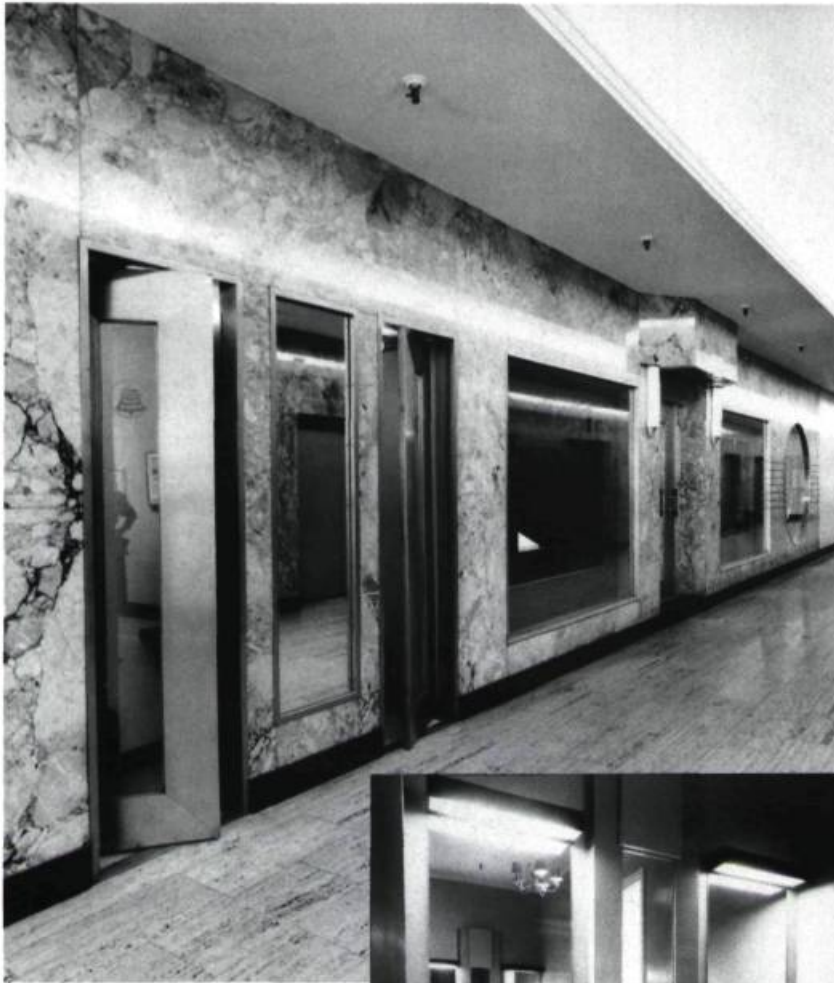
Dans le hall des ascenseurs, les vitrines, tour à tour rondes et carrées, sont encadrées de marbre.