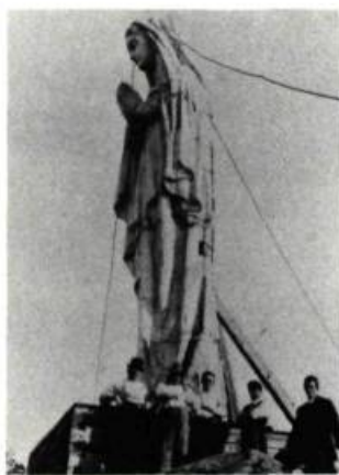
La statue de Notre-Dame du Saguenay, au sommet du cap Trinité.

L'Anse-Saint-Jean. Au coeur du village se trouvent trois constructions d'intérêt: un pont couvert (1930), le presbytère et l'église de pierre (David Ouellet arch., 1890) qui renferme une statue polychrome de Louis Jobin représentant saint Jean-Baptiste (1883).