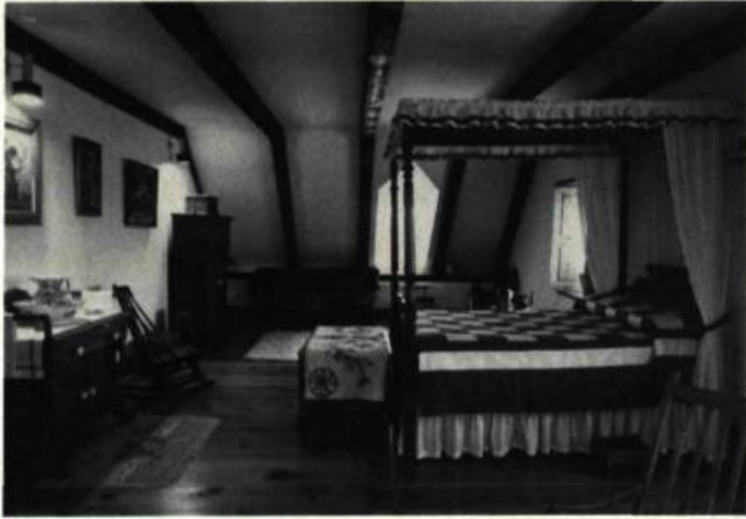
Le moulin abrite une riche collection de meubles et d'objets anciens recueillis au fil des ans dans la région. Ici, la chambre des maîtres.