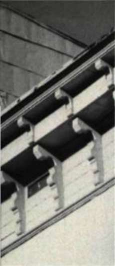
De fabrication artisanale, les corniches en bois doivent être démontées et réparées en atelier.

Les corniches en bois sont formées de plusieurs pièces clouées ensemble. On répare les éléments plus difficiles à reproduire. On les démonte éventuellement pour travailler en atelier. Dans la plupart des cas, on remplace simplement les planches endommagées en démantelant la corniche sans abîmer les autres composantes.