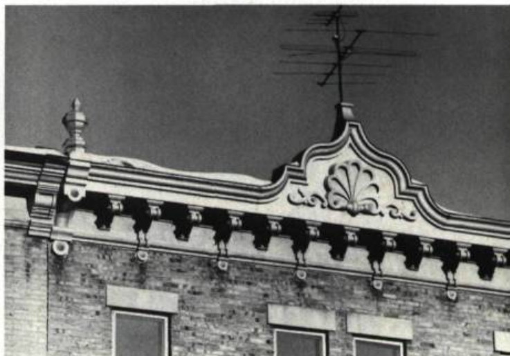
Dans le cas d'un bâtiment à toit plat, la corniche protège les parties sous-jacentes des intempéries et est souvent le seul élément ornemental de la façade.

La corniche étant un élément important de la composition d'une façade, il faut tenir compte de sa valeur et de son rôle lorsqu'on la remplace en tout ou en partie. La plupart des ferblantiers et des menuisiers peuvent facilement reproduire les moulures simples, en tôle ou en bois, ou fabriquer des modèles similaires. Certains ateliers de menuiserie ou de ferblanterie confectionnent des corniches de remplacement plus élaborées. Il se fait également des moulages en matière plastique, ce qui permet de répéter un motif particulier. Certaines compagnies spécialisées en produits pour la rénovation offrent aussi des modèles convenables.