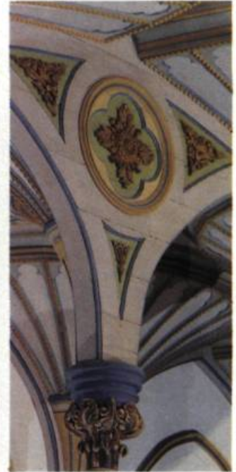
Le décor des écoinçons des voûtes.