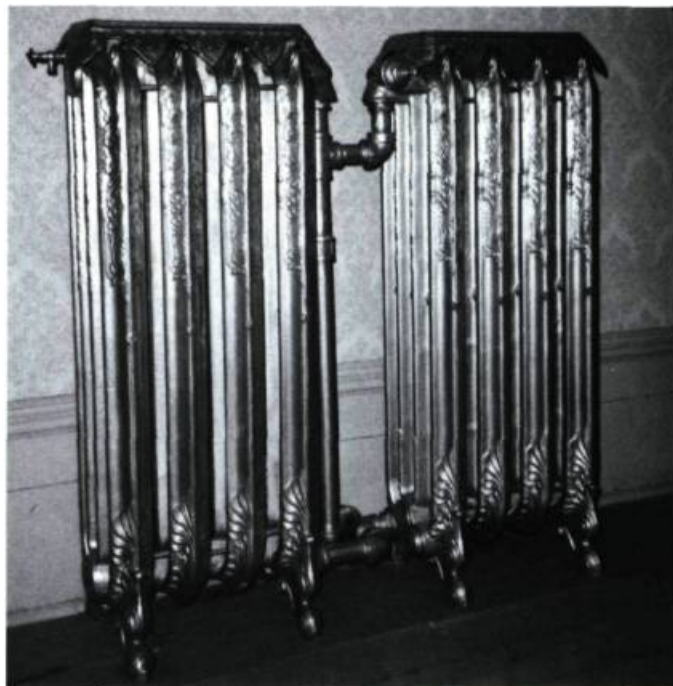
Bel exemple de calorifères décoratifs bien conservés et mis en valeur dans une ancienne propriété convertie en musée.

Parmi les principales composantes d'un système de