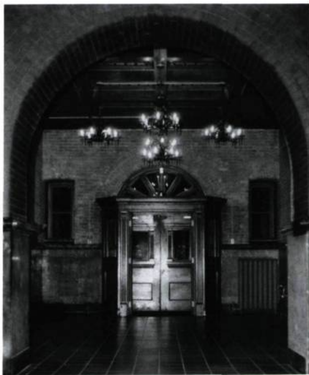
Le hall d'entrée a été restauré tout comme l'escalier principal et le grand amphithéâtre.

En 1985, l'Université McGill confia à Arcop et Associés la conversion de l'édifice afin d'y loger l'École d'architecture, l'École d'urbanisme et le département de génie métallurgique. À cette époque, le bâtiment abritait un certain nombre de petits départements ainsi que des services, et il se trouvait dans un état assez délabré. Il avait subi au cours des années de nombreuses modifications improvisées dont plusieurs étaient temporaires. Par exemple, un studio de télévision de fortune occupait presque tout le troisième étage, le vaste auditorium avait été divisé en deux et une grande partie de l'immeuble n'était qu'un labyrinthe de petites pièces.