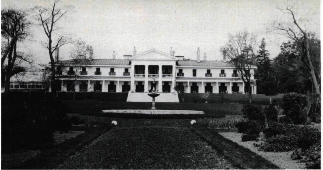
Bois-de-Coulonge en 1916. Pour encadrer cette prestigieuse résidence néo-classique, le jardinier Peter Lowe a conçu une allée monumentale, ornée d'un bassin et d'une fontaine (qui existe encore aujourd'hui), élément central du jardin pittoresque.

À Montréal, très tôt des jardins à la française s'ordonnent autour des institutions religieuses. Les jardins du monastère des Récollets, de l'Hôtel-Dieu (1642-1859), du couvent des sœurs de la congrégation Notre-Dame et, au milieu du siècle, celui du séminaire des Jésuites, en sont des exemples. Parmi ces premiers jardins, seul celui des Sulpiciens, rue Notre-Dame, a gardé sa configuration d'origine, qui emprunte à celle des jardins monastiques européens.