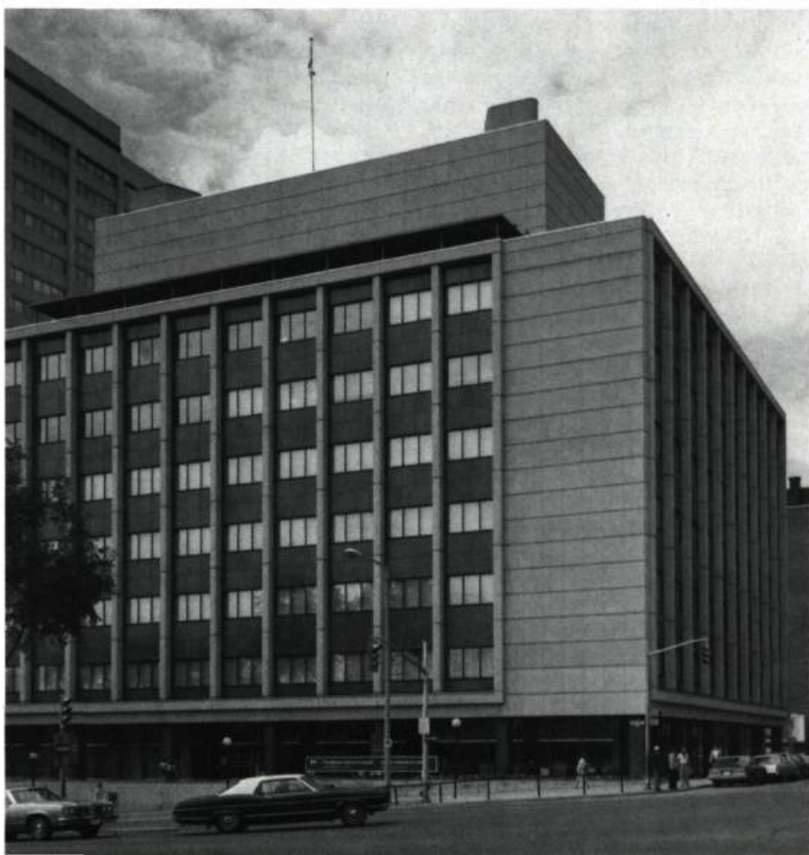
Le Musée des beaux-arts du Canada quittera cet édifice anonyme pour s'installer dans un espace fait «sur mesure».

Pourtant, la muséologie ne dispose pas pour s'exprimer de véhicule plus important que l'espace même de l'institution. L'espace, ses qualités propres, son