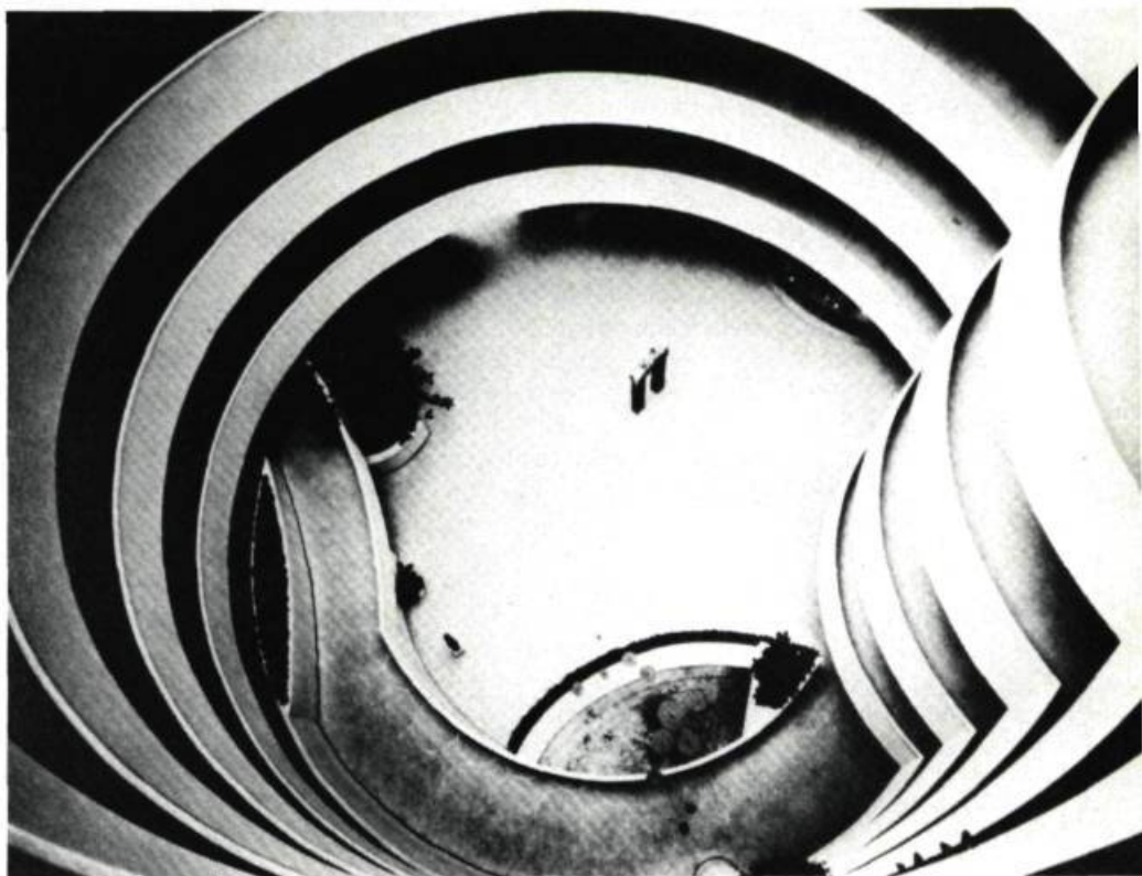
L'intérieur du célèbre Guggenheim Museum, à New York (1943-1959). Une oeuvre de l'architecte Frank Lloyd Wright. Un musée dont l'image est à l'antipode de la «clandestinité».