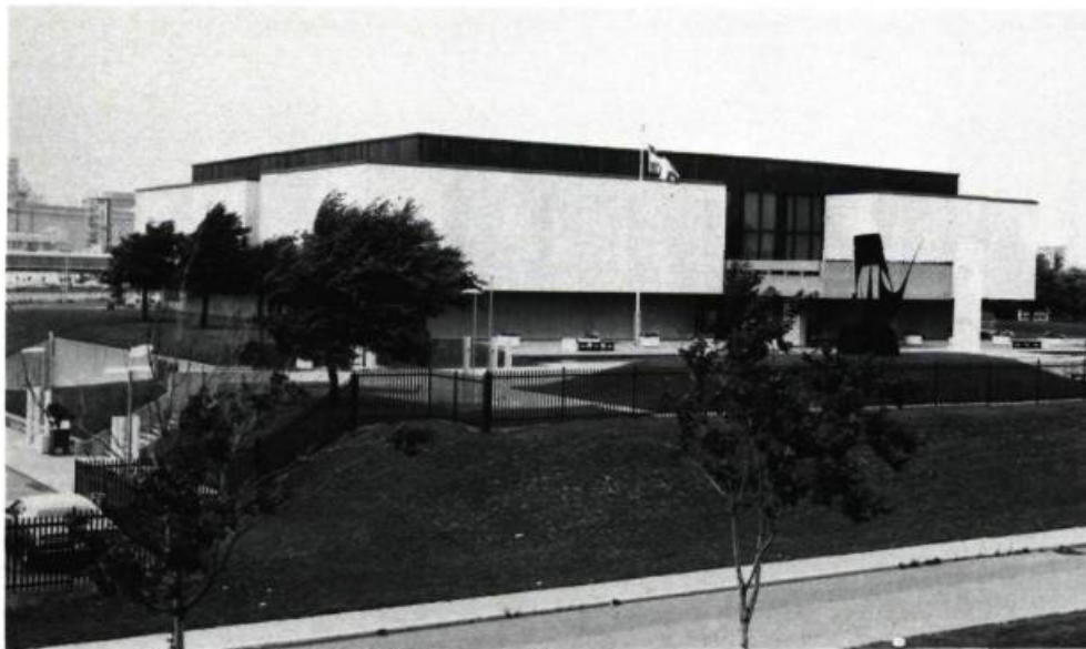
Le personnel des musées doivent tirer le meilleur parti des lieux, malgré leur inadéquation. Le site actuel du Musée d'art contemporain de Montréal à la cité du Havre.

emplacement, son accessibilité tant physique que psychologique, conditionnent énormément les gestes posés par le musée. Le musée produit aussi, bien sûr, des activités qui peuvent être « consommées » à distance: catalogues d'exposition, publicité, image dans les médias, présence dans d'autres musées (ou d'autres lieux), etc. Toutes ces activités ont cependant un caractère périphérique par rapport à celles qui ont lieu dans le musée même, c'est-à-dire dans l'espace dont il a la maîtrise et qu'il rend disponible, de façon continue, au public. Cet espace est son cadre d'action principal, celui qu'il peut transformer à son gré et qui demeure son premier point de référence. Le cas des musées, de plus en plus nombreux, qui sont installés dans des bâtiments qui avaient auparavant d'autres fonctions, nous montre bien qu'il n'est pas nécessaire que l'espace qu'occupe le musée ait été conçu spécifiquement pour cette fonction.