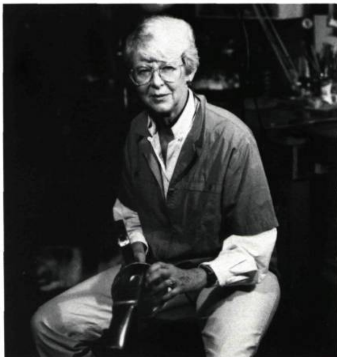
L'artiste dans son atelier.

Artiste accomplie, madame Betteridge a participé durant ses 32 années de carrière à plus de 90 expositions nationales et internationales (dont une quinzaine solo), a donné plus de 25 conférences, a enseigné à plu-