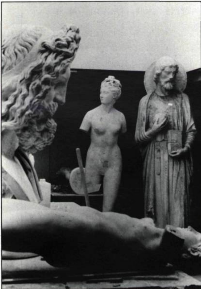
La collection des moulages de plâtre de l'ancienne École des Beaux-Arts de Québec ne connaît pas d'équivalent au Canada. En 1962, le nombre de pièces atteignait 4000.

d'ordre esthétique en raison de la valeur intrinsèque des chefs-d'œuvre copiés, mais elle tient également au contenu didactique évident de la collection. La collection de moulages constitue un corpus fort riche pour notre jeune patrimoine artistique. Plusieurs artistes du Québec d'aujourd'hui n'en sont-ils d'ailleurs pas les héritiers? Cette appréhension du passé, qui s'inscrit au cœur des dé-