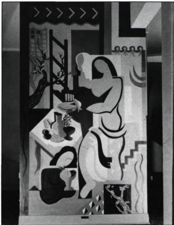
4. La murale décorant l'entrée de la même maison par Zette Boyer-Gagnon et Claude Hinton.

évolution: les meubles des élèves de Julien Hébert, qui commence à enseigner à l'École en 1948, reflètent ce changement.