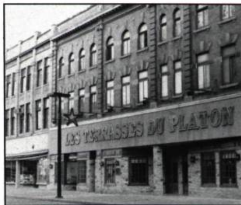
La façade «rénovée» de l'édifice auparavant occupé par la compagnie Zellers. L'allure Nouvelle-France de la devanture jure terriblement sur cet édifice de style victorien.

Malgré son état déplorable, d'autres dangers menacent la rue des Forges. Les divers projets de reconstruction mis de l'avant risquent d'accroître la disparité architecturale de la rue. La menace est réelle et les effets déjà perceptibles. Quelques hommes d'affaires trifluviens désirant réaménager de vastes locaux laissés vacants par le départ de la compagnie Zellers vers le centre commercial Les Rivières, ont complètement refait la façade de l'édifice. Initiative fort louable, certes, sans parler des efforts remarquables que l'on a déployés, mais les résultats ne laissent pas d'être catastrophiques.