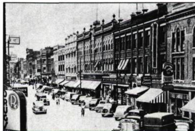
Une partie de la rue des Forges au moment de son expansion vers 1930. On y aperçoit les devantures de Woolworth et de Zellers.

Dès le milieu du XIX e siècle, la rue qui mène aux Forges du Saint-Maurice s'affirme, au détriment de la rue Notre-Dame, comme la principale artère