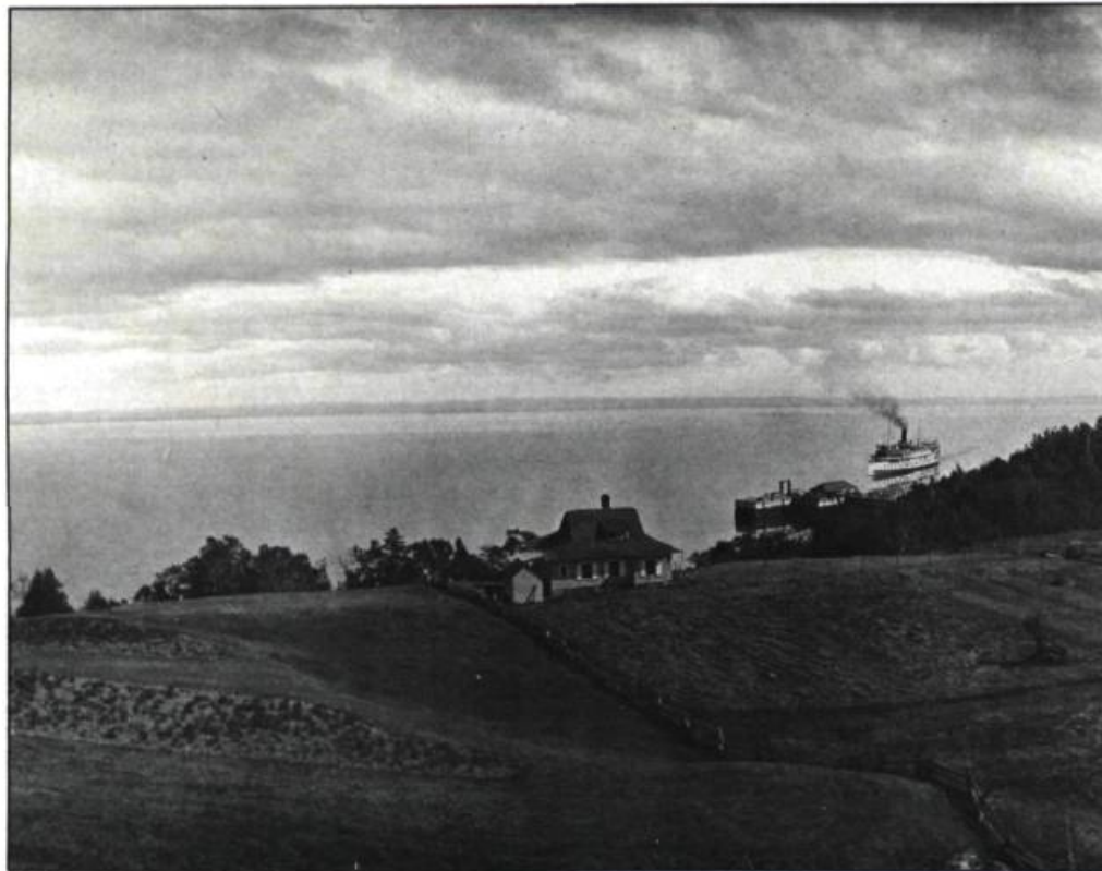
Vue panoramique sur le fleuve Saint-Laurent vers 1920. Au loin, un vapeur de la Canada Steamships Lines se dirige vers le quai de Cap-à-l'Aigle. Ces bateaux, surnommés Bateaux-Blancs, ont assuré jusqu'en 1966, un service de croisière vers le Saguenay.

Même si d'apparence un peu vieillotte, voire parfois rustique, la sobriété intérieure ainsi que les aspects pratiques de la divi-