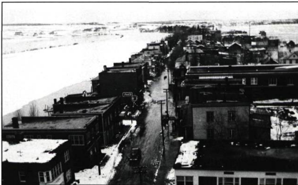
La rue Notre-Dame à Ste-Marie de Beauce fera l'objet d'un projet Main street grâce au travail de la Société patrimoine des Beaucerons. Ici, la rue en direction Nord en avril 1947.

gionalisation du MAC ont certes le mérite d'engager la responsabilité et les énergies des municipalités. Mais elles le priveront peut-être de l'engagement de précieux alliés. . . ■