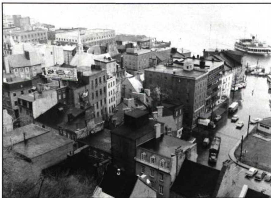
La Place royale avant la réalisation du projet des années 1960-1970 dont le concept privilégiait une reconstitution des témoins du Régime français.

Au moment où le Conseil s'assure d'un certain confort et structure son secrétariat et sa gestion, l'activité des groupes locaux de pression tend à s'estomper au profit d'une présence plus marquée dans les régions des Conseils de la culture et des bureaux régionaux du ministère des Affaires culturelles. L'idéologie technocratique domine la scène patrimoniale et puise son inspiration dans les méthodes éprouvées de Parcs Canada, d'ICOMOS et des services de pla-