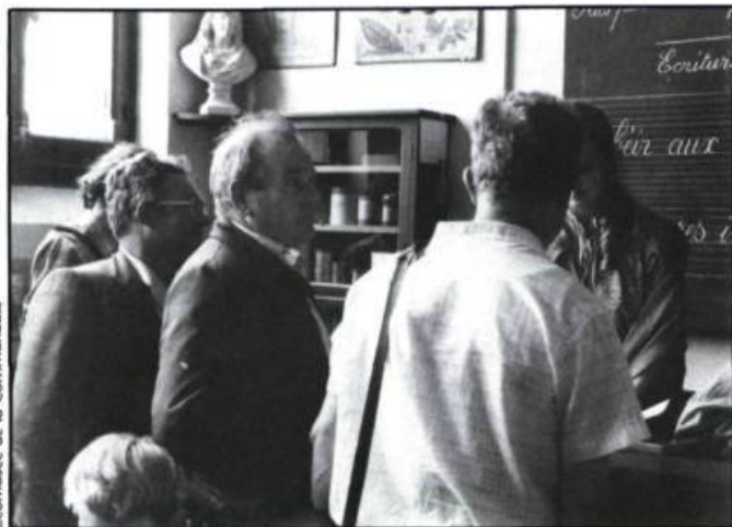
Écomusée de la Communauté

Il a semblé aujourd'hui nécessaire d'assurer en un même lieu le Château de la Verrerie la cohérence des travaux et repris par les trois organismes du Creusot en les fédérant dans le Centre culturel de rencontre et de recherche sur la civilisation industrielle. Ses actions diversifiées veulent montrer qu'une perspective culturelle vraiment contemporaine n'envisage plus la culture comme un domaine en marge des situations de travail; elle recouvre les divers