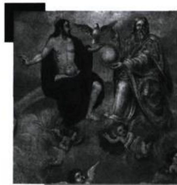
Anonyme, détail de La France apportant la foi aux Hurons de la Nouvelle France XVII e siècle. Huile sur toile 227,3 × 227,3 cm. Prêt de la collection du Monastère des Ursulines de Québec.

Une occasion unique de voir, pour la première fois, la plus importante exposition associant l'art et l'histoire de l'Église catholique au Québec.