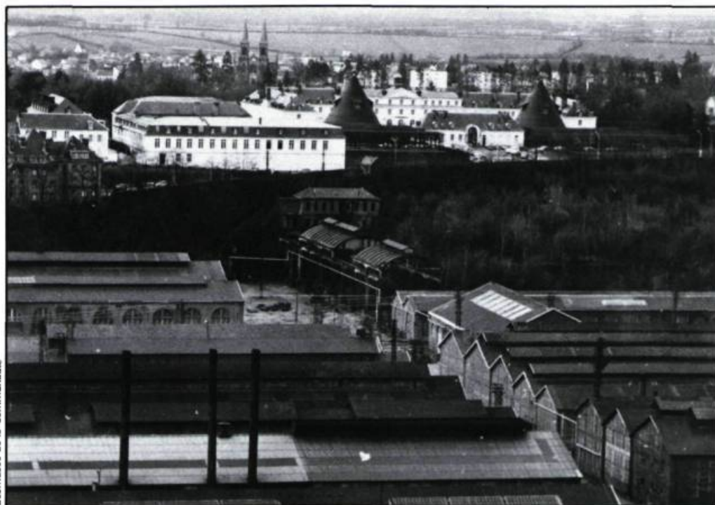
Écomusée de la Communauté

Le Château de la Verrerie (France), siège de l'Écomusée de la Communauté Le Creusot/Montceau-les-Mines et du Centre culturel de rencontre et de recherche sur la civilisation industrielle.