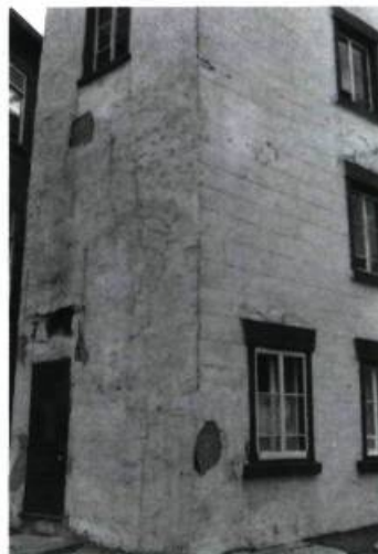
4. Trop souvent, les crépis de ciment fissurent, craquent et se décollent par plaques.