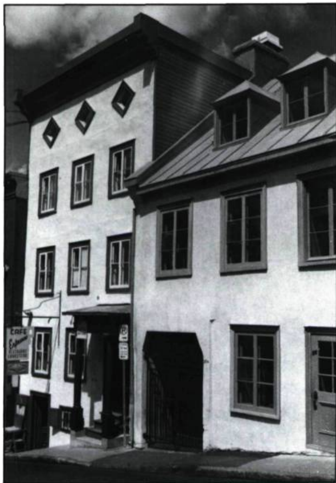
5. Deux bâtiments crépis de coloration et de texture légèrement différentes et remarquablement harmonisées.