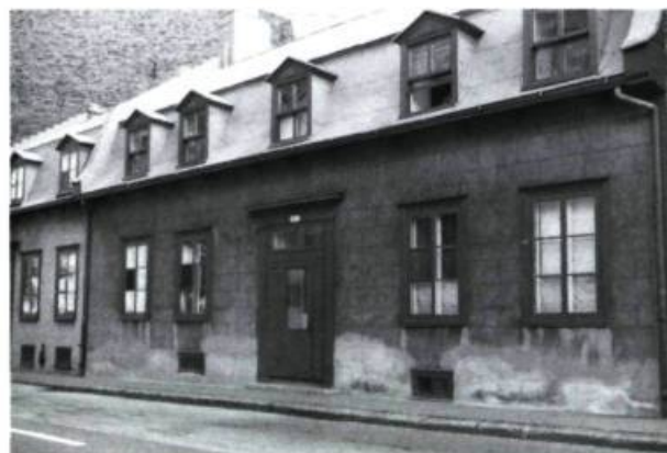
2. Bâtiment dont le crépi imite la pierre taillée.