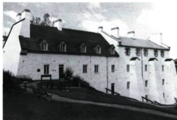
3. Bel exemple de crépi appliqué sur la Redoute Dauphine au parc de l'Artillerie à Québec. Cet édifice datant du Régime français a fait l'objet de travaux de restauration majeurs par Parcs Canada.