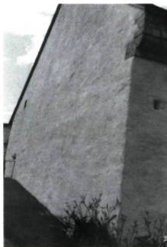
7. Le crépi devrait épouser le relief irrégulier de la maçonnerie. Redoute Dauphine au parc de l'Artillerie, Québec.