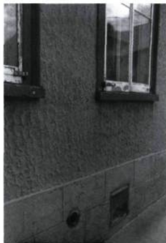
1. Le mur est ici recouvert de crépi à la texture «époncée» alors qu'à la base, il imite la pierre taillée pour marquer la fondation.

Compte tenu des différents facteurs que nous avons évoqués et du cas d'espèce que représente chaque bâtiment, la