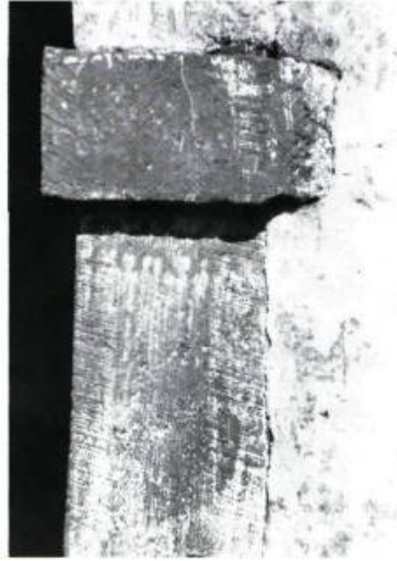
8. Le crépi vient «mourir» contre l'encadrement de pierres taillées, mettant ainsi ce détail en relief. Chapelle du calvaire d'Oka.

sion, de contraction ou autres de se manifester: on pourra ainsi colmater les fissurations et craquements éventuels au moment de la couche de finition.