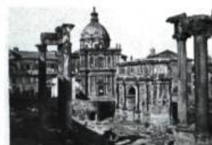
PHOTOGRAPHIE ET ARCHITECTURE 1839-1939