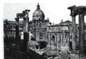
PHOTOGRAPHIE ET ARCHITECTURE 1830-1939