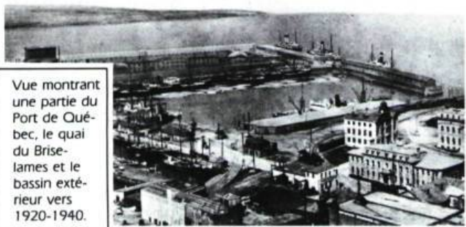
Vue montrant une partie du Port de Québec, le quai du Brise-lames et le bassin extérieur vers 1920-1940.