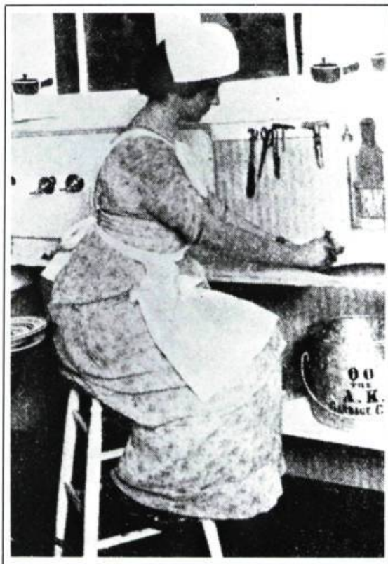
La « nouvelle ménagère » en 1915: se réappropriant l'espace domestique (Tiré de: Household Engineering, 1915).