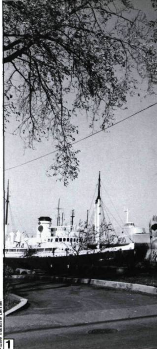
Musée maritime Bernier

Certes, il nous reste peu d'artefacts des grands voiliers construits dans la vallée du Saint-Laurent ou des navires destinés au cabotage à voile; quelques recherches sont en cours afin de découvrir les restes de ces activités maritimes. Mais depuis quel-