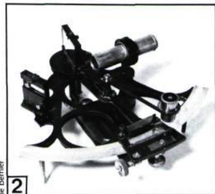
Musée maritime Bernier