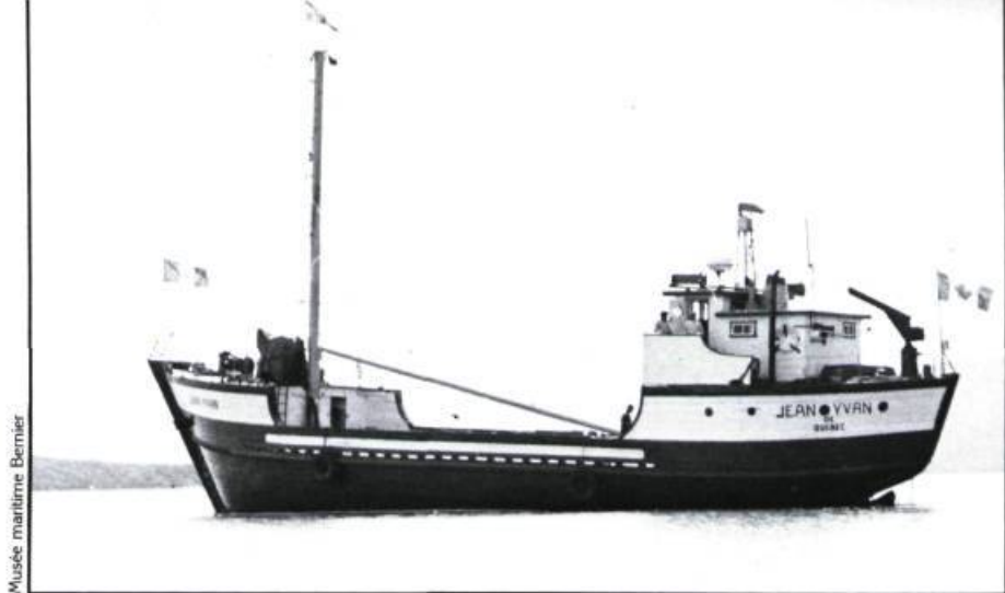
Musée maritime Bernier

On ne saurait prendre à la légère la décision de sauvegarder un ou des navires typiques, représentant différents modèles technologiques. Citons à cet égard les pièces conservées au Musée maritime Bernier: la goélette en bois «Jean Yvan», le brise-glace en acier «Ernest Lapointe» et le «Bras d'or», un hydroglisseur en aluminium. Outre des