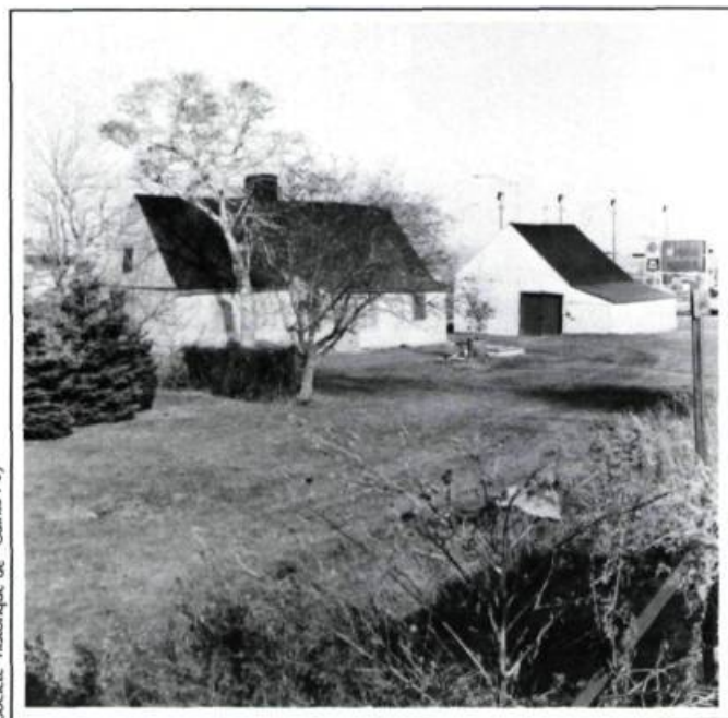
Société historique de Sainte-Foy

En classant son site, on éviterait sans doute le déplacement de la maison Bonhomme.