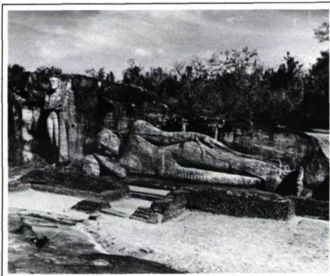
Bouddhas debout et couché sur le site de Galvihara.