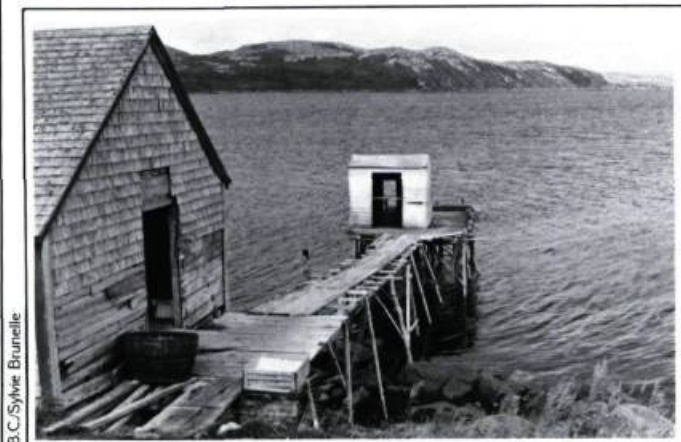
Split house installé sur la tête de chafaud à Rivière-Saint-Paul.