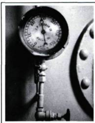
Cadran indicateur de pression à l'intérieur de la bache spirale d'une turbine installée en 1911 à la centrale Shawinigan-2. Cette turbine fonctionne toujours.

Il existe, par exemple, des sites qui sont le lieu d'activités industrielles depuis une centaine d'années. Incontestablement, ces espaces auront subi de multiples transformations suivant les changements de production, de processus, ou de volume d'activités au fil des ans. De même voit-on se modifier les structures et les bâtiments. Les formes extérieures des ensembles industriels sont largement dominées par les contraintes spécifiques des espaces intérieurs. Aussi ces formes ne correspondent-elles que rarement aux canons de la symétrie et de l'équilibre classique, et se répandent plutôt en de multiples protubérances organiques. Toutefois, dans de vieux complexes industriels, à travers l'apparente anarchie des surfaces, des volumes, des matériaux et des couleurs entremêlés, survivent quelques bâtiments au dessin particulièrement classique encore perceptible sous de multiples modifications dont les modes d'expression appartiennent à d'autres langages. Ces édifices, généralement les plus anciens du complexe, témoignent d'une