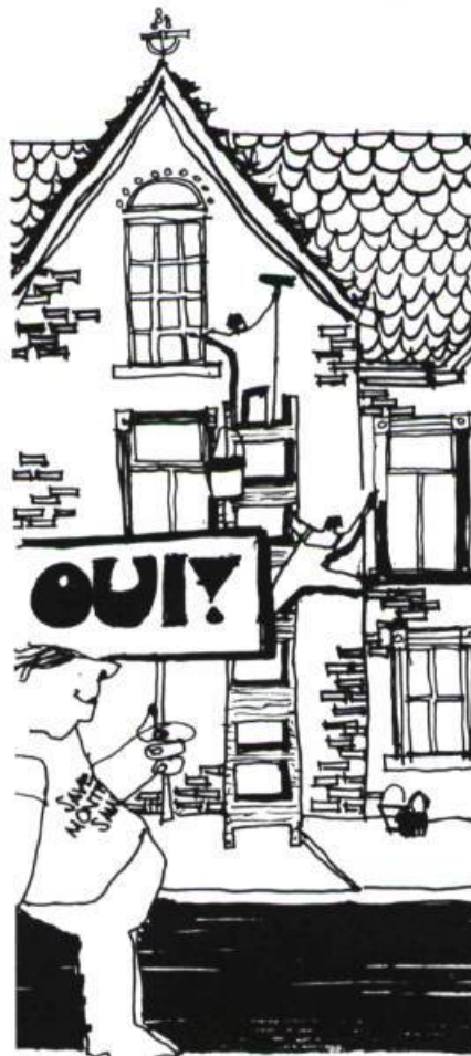
SOS Montréal, octobre 1977. Le mouvement s'engage plus positivement. La promotion de la rénovation et la revitalisation des quartiers s'ajoutent à ses actions de sauvetage.

Les deux premières années, ils luttèrent surtout pour préserver des bâtiments isolés — souvent en requérant leur classement du Gouverne-