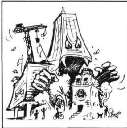
Les années 1970 témoignent d'une véritable «guerre» entre «conservationnistes» et promoteurs.

1. Perception du public: Il y a dix ans, un sondage sur l'opportunité de démolir la gare Windsor aurait révélé à une majorité écrasante: «Oui, débarrassez-nous de ce tas de vieilles pierres grises pour que nous puissions avoir un bel édifice moderne». Aujourd'hui, je suis sûr que les pourcentages seraient inversés et que 95% de la population opterait pour la préservation.