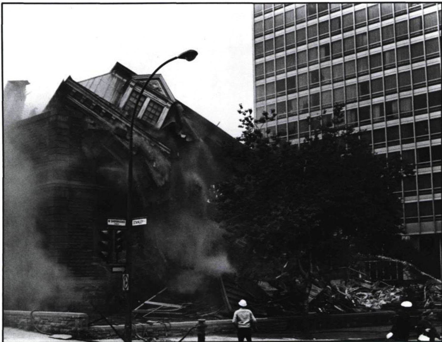
La démolition de la maison Van Horne en 1973 enclenche, à Montréal, un mouvement de préservation engagé.

par Mark London, directeur général exécutif d'Héritage Montréal