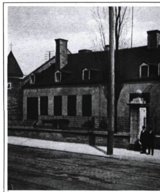
Rare spécimen de l'architecture militaire française: le fort Chambly vers 1867. Construit au début du XVIII e siècle, modifié avant la Conquête, il est restauré en 1882 et 1883. Aujourd'hui, la nouvelle campagne de restauration effacera les traces de la première, plus respectueuse de ces vestiges.