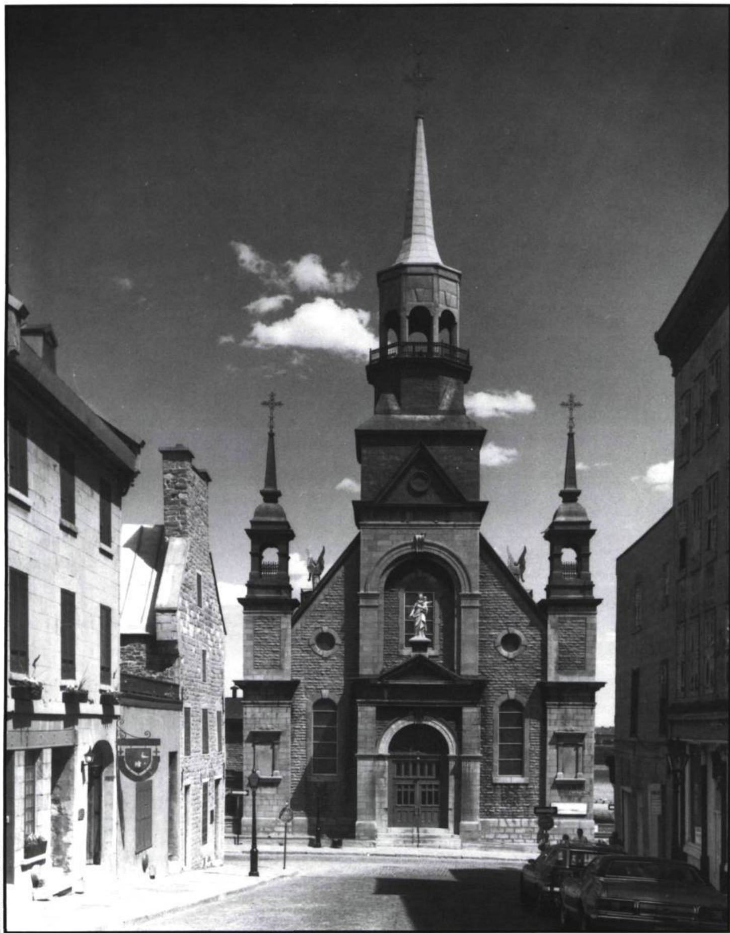
Menacée plusieurs fois, la conservation de l'église Notre-Dame-de-Bonsecours dans le Vieux-Montréal fut assurée à la fin du XIX e siècle mais les Sulpiciens y entreprirent des travaux de réfection qui en modifièrent radicalement l'aspect.