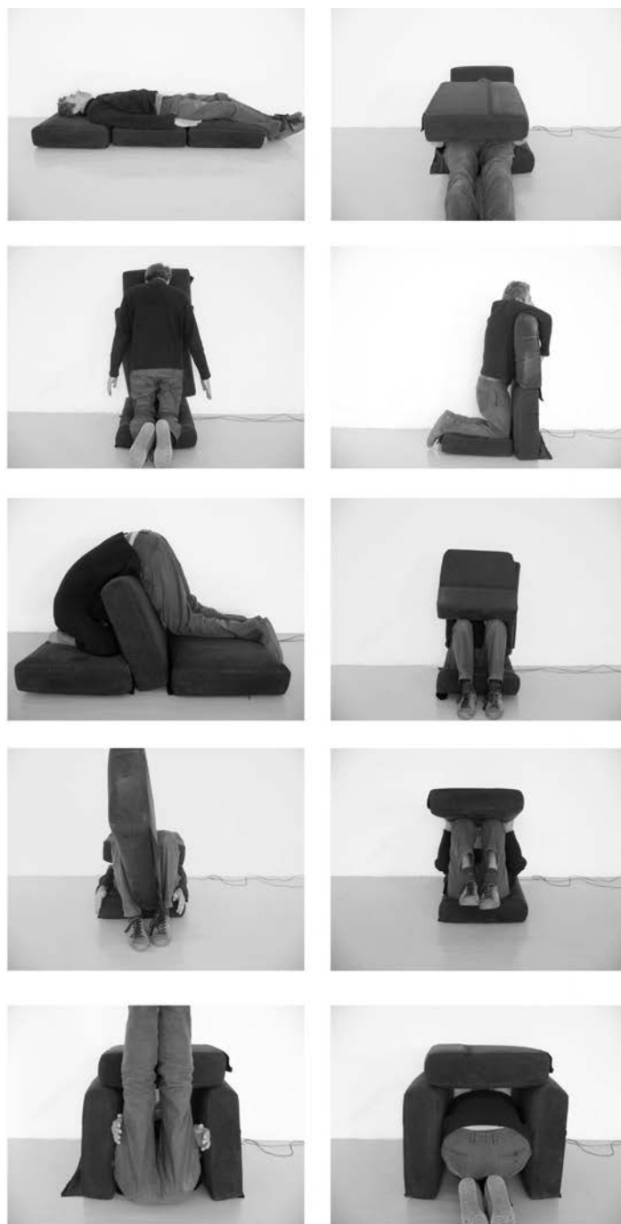
FIGURE 2 Bernard Pourrière, Coussins , 2012.