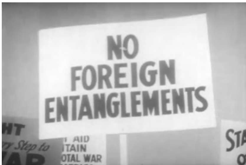
Figure 8. Why We Fight: Prelude to War (Frank Capra, 1942).