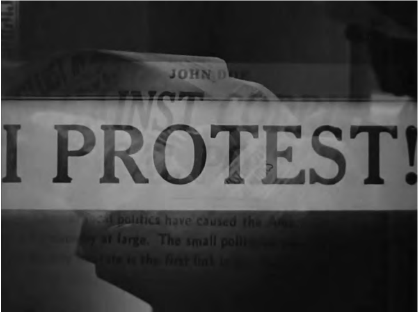
Figure 2. Meet John Doe (Frank Capra, 1941).