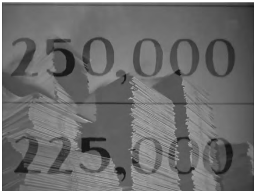
Figure 4. Meet John Doe (Frank Capra, 1941).