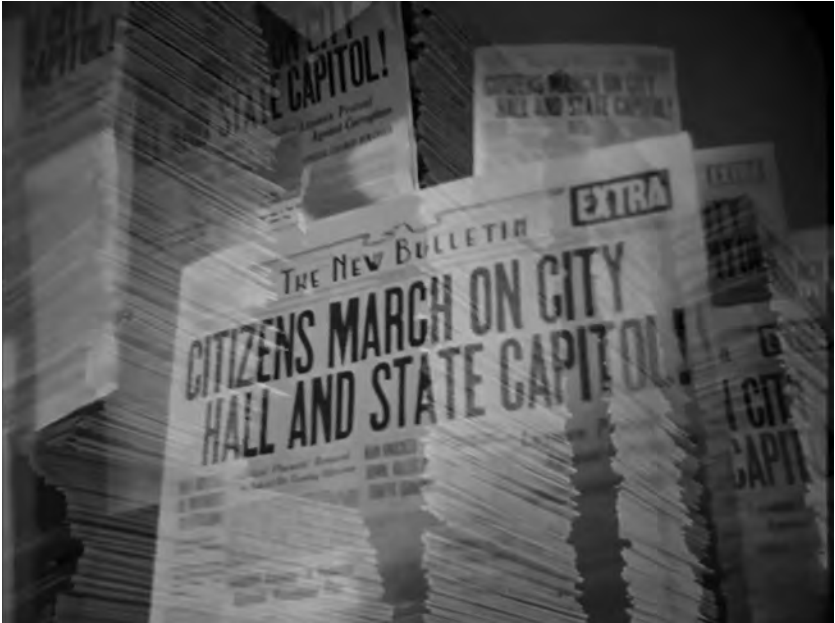
Figure 3. Meet John Doe (Frank Capra, 1941).