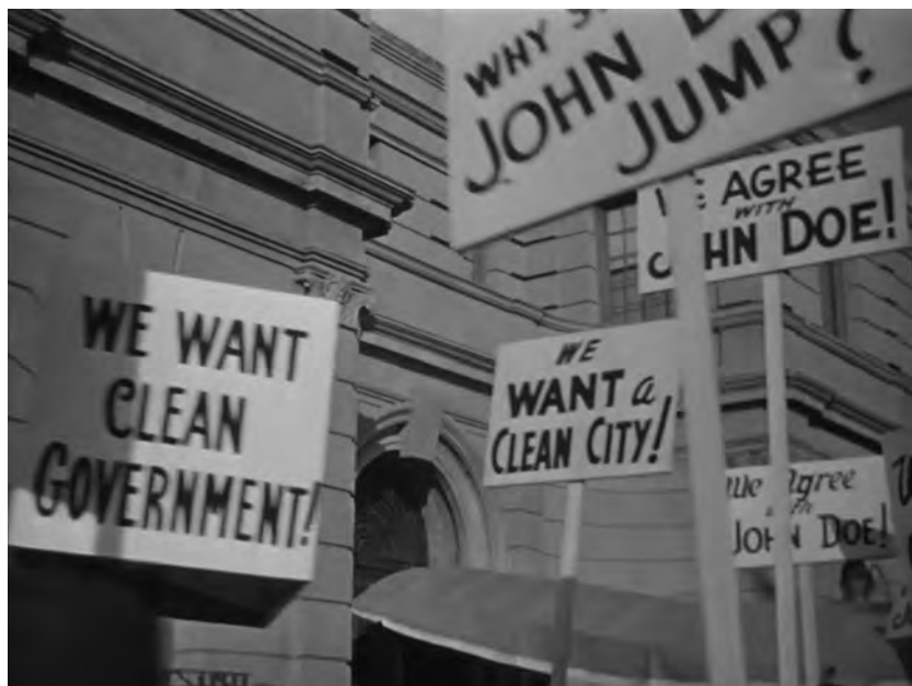
Figure 5. Meet John Doe (Frank Capra, 1941). © Frank Capra Productions.