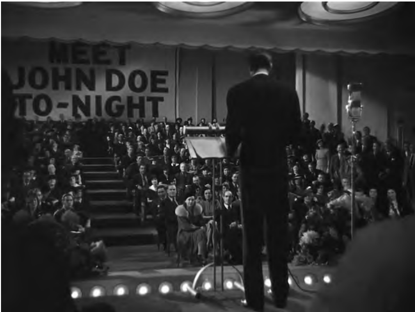
Figure 6. Meet John Doe (Frank Capra, 1941).

C'est avec Mr. Smith que Capra s'attelle pour la première fois à la tâche de représenter l'agir collectif. À la fin du film, en parallèle de l'obstruction parlementaire, on voit une manifestation de soutien au sénateur, rapidement dispersée par la police. Le peuple est figuré ici sous son versant le plus présentable: des hommes portant costume et chapeau, une fanfare, une foule organisée de manière à ne pas occuper la totalité de la rue, bref, rien de cette population misérable que dépeignait le film précédent. Le cortège est exclusivement composé d'hommes; tout se passe comme si les femmes étaient tenues à l'écart, si ce n'est de l'action politique dans son intégralité – comme en témoigne le personnage de Clarissa Saunders, interprétée par Jean Arthur – du moins, de ses formes militantes et collectives. Les opposants de Smith, quant à eux, n'existent même