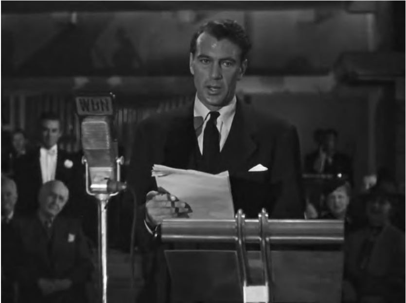
Figure 1. Meet John Doe (Frank Capra, 1941).

reprises qu'on lui explique le sens d'une expression d'origine populaire ( pixilated , mot d'argot signifiant «excentrique», puis to doodle , «gribouiller»). En même temps qu'il nous invite à prêter attention au langage populaire, avec ses singularités et ses codes qu'il convient de maîtriser, Capra s'en saisit comme d'un instrument de subversion, s'amusant à introduire des éléments étrangers dans la langue sophistiquée de l'élite.