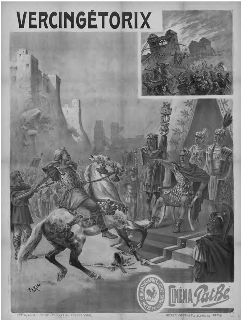
Figure 9. Cândido Aragonez de Faria, affiche pour le film Vercingétorix (Pathé Frères, 1909).

universitaires du XIX e siècle et des traductions successives de Caesar in Gaul qui la reproduisaient en frontispice, ce qui pourrait en partie expliquer qu'on en devine encore l'influence dans la scène de reddition du premier épisode de Rome , la série de HBO (Wyke 2006, 60; 2012, 76-85).