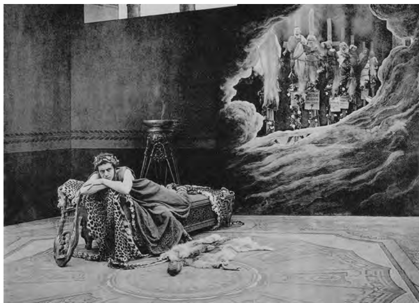
Figure 2. Alberto Capozzi dans Nerone (Luigi Maggi, 1909). Collotype.