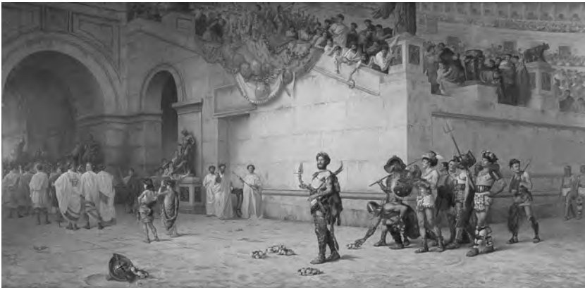
Figure 5. Edwin Blashfield, Commodus Leaving the Coliseum, 1878. Huile sur toile, 123,2 cm × 231,1 cm. Sloane Collection, Hermitage Museum & Gardens, 1941.0022.01.