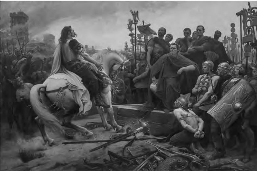
Figure 8. Lionel Royer, Vercingétorix devant César , 1899. Huile sur toile, 321 cm × 482 cm. Musée Crozatier, 1903.59.

C'est que cette imagerie du XIX e siècle avait été largement diffusée. La célèbre peinture de Lionel Royer qui se trouve aujourd'hui au musée Crozatier du Puy-en-Velay, Vercingétorix jette ses armes au pied de César (Fig. 8), fut reproduite dans Le Monde illustré l'année même de sa création et se retrouva rapidement dans les livres d'histoire et les manuels scolaires (Hallopeau 1980, 33), aussi n'est-il pas surprenant d'en retrouver la trace dans l'affiche du film Vercingétorix produit par Pathé en 1909 (Fig. 9). Le tableau acquit aussi une grande réputation aux États-Unis par l'intermédiaire des ouvrages