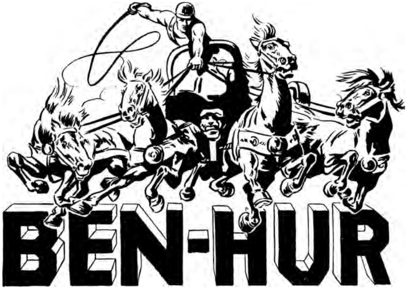
Figure 10. «Ben-Hur», dessin promotionnel.