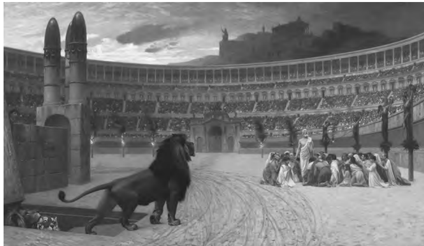
Figure 3. Jean-Léon Gérôme, Dernières prières des martyrs chrétiens, 1863-1883. Huile sur toile, 87,9 cm × 150,1 cm. Collection du Walters Art Museum, 37.113.