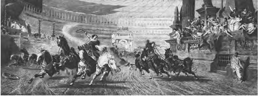
Figure 4. Chariot Race in the Circus Maximus, Rome, in the Presence of the Emperor Domitian , 1875. Gravure de Stephen J. Ferris et Peter Moran d'après le tableau éponyme d'Alexander von Wagner, 22 cm × 57 cm. Graphic Arts Collection, National Museum of American History, Smithsonian Institution, 94830. © Smithsonian Institution.