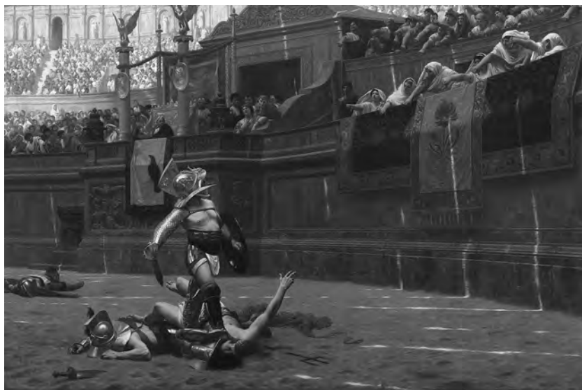
Figure 1. Jean-Léon Gérôme, Pollice Verso , 1872. Huile sur toile, 96,5 cm × 149,2 cm. Collection du Phoenix Art Museum, acquisition du musée, 1968.52. © Phoenix Art Museum, Phoenix. © (Photographie) Mike Lundgren.

Cette rhétorique se comprend, eu égard à l'efficacité du film et à ses audaces. Un grain de sable – venu de l'arène des gladiateurs? – perturbe cependant cette belle mécanique médiatique: Ridley Scott aurait en effet décidé de se lancer dans ce tournage après avoir vu l'image d'un tableau de Jean-Léon Gérôme daté de 1872, Pollice Verso , aujourd'hui au Phoenix Art Museum (Fig. 1), et ce, avant même d'avoir lu le synopsis détaillé de l'intrigue (Parrill 2011, 105; Scott 2000; Winkler 2004, 22-23). Gladiator , en d'autres termes, réactiverait une imagerie vieille de plus d'un siècle et serait même à envisager comme un «hommage rendu aux peintres pompieri» (Soler et Scapin 2011, 245), ces artistes défenseurs d'une peinture traditionnelle et volontiers antiquisante, auxquels on attribua, dès les années 1870, ce surnom indubitablement railleur, quelle qu'en soit l'explication 4 . De façon générale, l'Antiquité, tel qu'elle est figurée à l'écran – au cinéma ou dans les séries télévisées –, doit beaucoup à l'image qu'en fixa la peinture académique dans la seconde partie du XIX e siècle. Une ascendance qui prit plusieurs formes, comme nous le verrons, mais dont il s'agira surtout de comprendre les logiques: plus