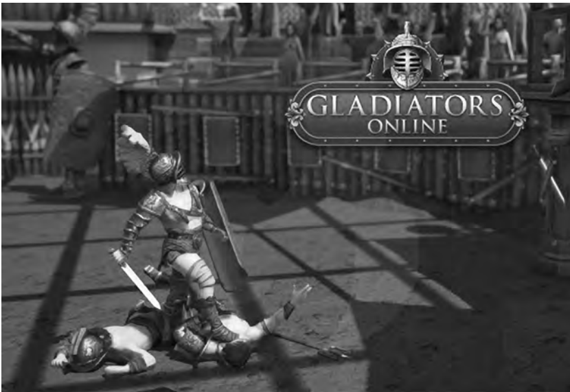
Figure 11. Gladiators Online . Jeu vidéo (Dorado Games, 2015).

de série qui déclina sa structure, son format et son design des formes empruntées au jeu vidéo. Aurions-nous alors affaire à une substitution de modèle? Le péplum en a-t-il donc fini avec la peinture académique, à laquelle il préférerait désormais l'esthétique du jeu vidéo? Rien n'est moins sûr, car, à en croire la manière dont cet univers du divertissement électronique adopte lui-même la peinture académique – à l'image du jeu Gladiators Online , de Dorado Games, qui en 2015 donnait à voir sur sa page d'accueil une version numérisée du Pollice Verso (Fig. 11) –, gageons que Gérôme et tous ses émules ont encore de beaux jours à vivre sur les écrans.