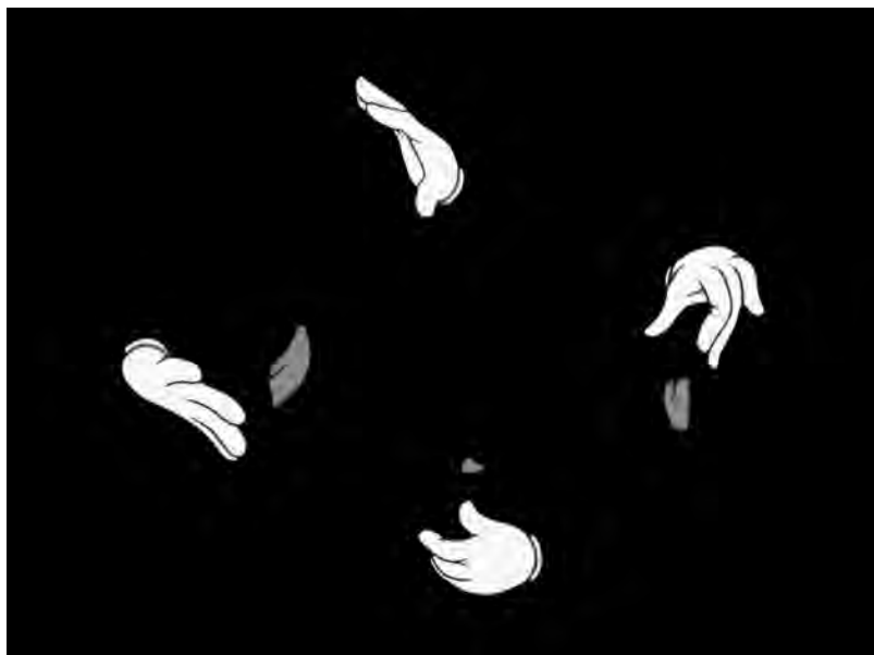
Fig. 5. Tooth Eruption (Martin Arnold, 2013).

La main, blanche et gantée, signe d'une humanité désorganisée par les pattes qui viennent la reléguer, est bien un motif récurrent des films désanimés, qui conditionne le noir visible par ces éclats de lumière colorés. Conducteur tactile de la vue désordonnée, elle est ce qui opère per via di levare . Dans Tooth Eruption (2013), il n'y a plus de figure et plus de fond, mais la mise en relief d'un mouvement pulsionnel, provoqué par cet espace creusé par des yeux, trous noirs qui surgissent des pattes ou globes vides qui louchent vers la langue (Fig. 5). Il est difficile de décrire dans ce