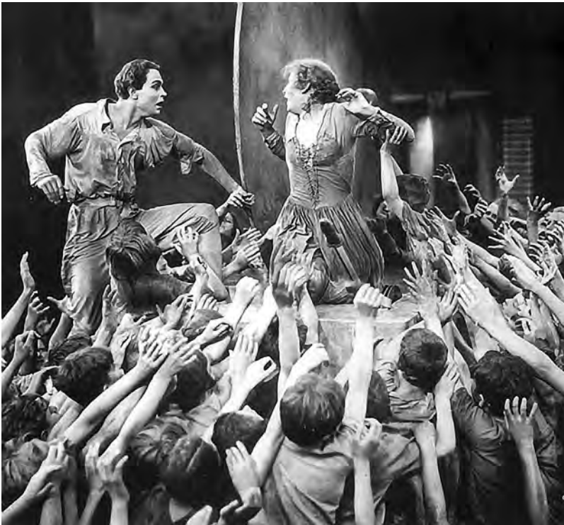
Fig. 8. Metropolis (Fritz Lang, 1927).

Dans Post-Post-Production (2004), Julien Prévieux opère selon une démarche symétriquement opposée à celle de Martin Arnold. Et c'est sur cet autre film de remploi que je conclurai mon propos. À partir d'une autre icône de la culture occidentale (James Bond), l'enjeu consiste à saturer un film entier, Le monde ne suffit pas , d'explosions, de fumées, de coulées de couleurs et de lave : autant d'effets visuels qui s'ajoutent aux effets spéciaux et détournent le spectateur de la logique dramaturgique à l'œuvre. Prévieux procède ainsi per via di porre , en ajoutant du visible sur du visible, contraignant le regard à voir ce qui surgit du fond impersonnel de l'image. Le film est d'ailleurs ainsi présenté dans le catalogue de l'artiste :