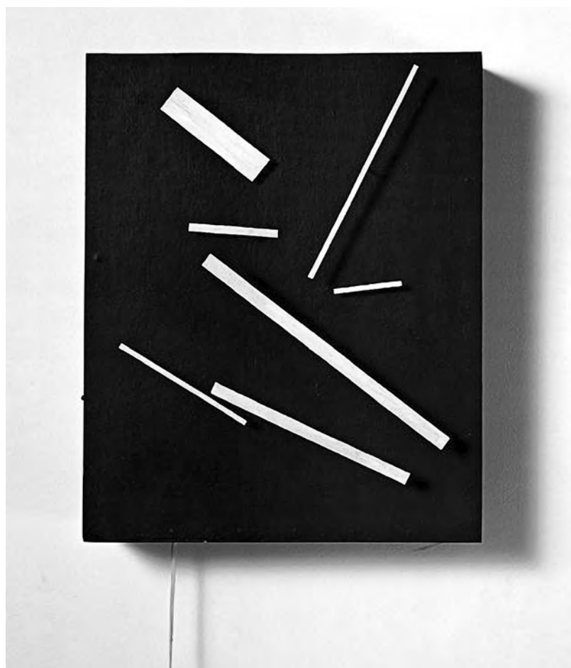
Fig. 3. Méta-Malevitch (Jean Tinguely, 1954).

Jacques Aumont (2009, p. 110) rappelle combien en peinture le noir est « ce qui entoure la figure, ce qui la fonde, ce qui lui permet d'exister. Le noir est une réserve, un lieu propre du pictural sur lequel peuvent s'enlever et d'où peuvent provenir les figures. » Cette capacité propre au noir d'introduire du mouvement dans la représentation a été exploitée par des artistes au milieu du siècle : Tinguely qui réalise des tableaux mobiles par adjonction derrière la toile d'un moteur électrique faisant bouger les formes ( Méta-Malevitch , 1954 ; Fig. 3), ou Agam qui incite le