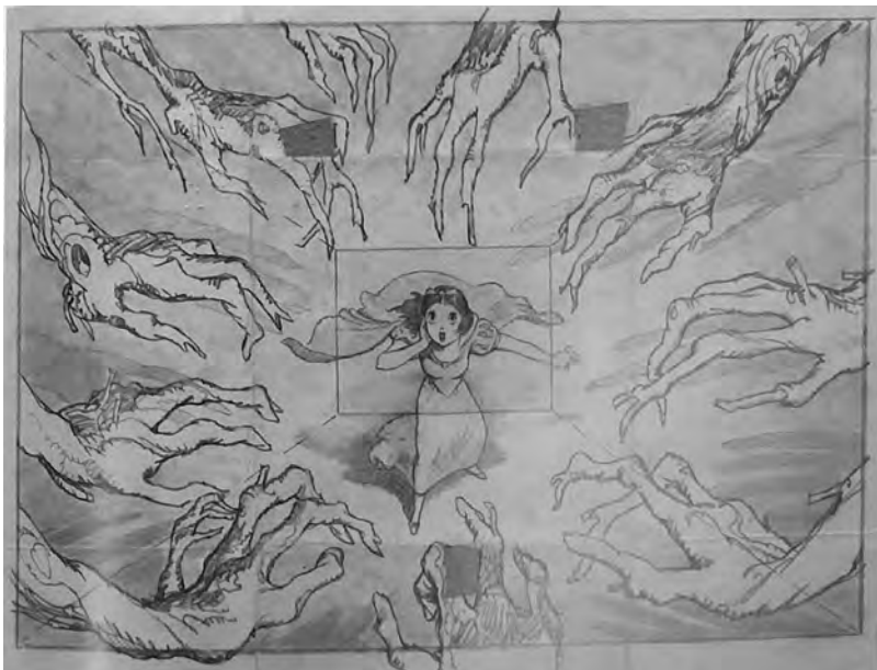
Fig. 6. « Blanche-Neige entourée de mains terrifiantes », dessin de storyboard , 1937.