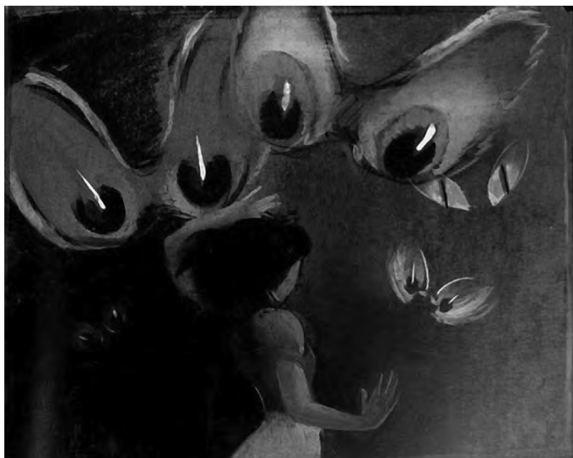
Fig. 7. « Blanche-Neige entourée d'yeux terrifiants », étude préliminaire, 1937.