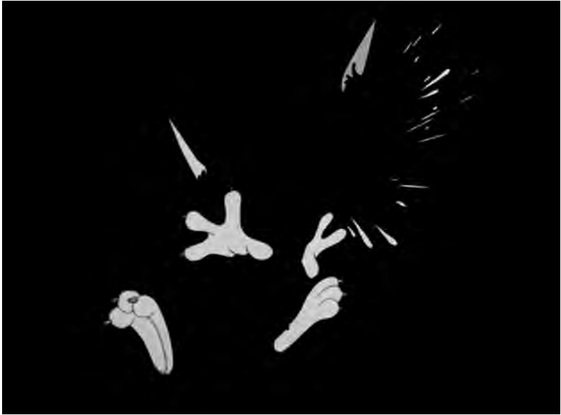
Fig. 2. Haunted House (Martin Arnold, 2011).

mémoire qu'ils répliquent en inventant les figures d'une instabilité spatiale qui renvoient à l'art abstrait.