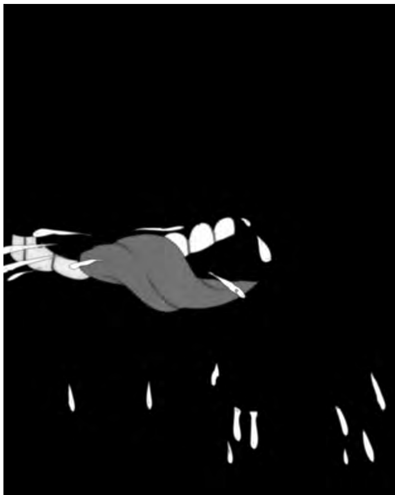
Fig. 1. Hydra — «monitor work» (Martin Arnold, 2013).

Cet acte de retrait consiste en une opération d'abstraction, selon le sens du mot compris au XIX e siècle comme une opération scientifique de sélection qui renvoie chez Arnold à une décomposition de la vision — ce que nous montre également Haunted House (2011).