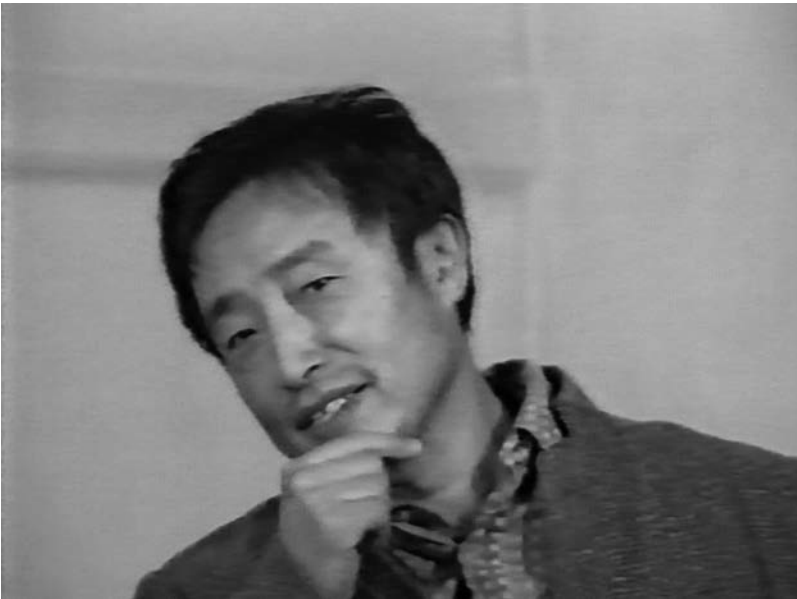
Fig. 6. Nam June Paik dans l'émission Nam June Paik: Edited for Television (1975) de la série Video Television Review diffusée sur la chaîne WNET/Channel 13.

Paik usait de la télévision comme d'un espace à coloniser. En tant qu'artiste, jouissant d'une externalité propice, il n'avait pas à se soucier des contraintes qui doivent peser fatalement sur une production télévisuelle. Les bandes vidéo de Paik font alterner enregistrements de concerts, clips de musique populaire et traditionnelle, entretiens et exposés théoriques. La dimension parodique y est importante ; on y trouve des parodies du monde des médias et de ses stéréotypes (interviews, spots publicitaires, émissions culturelles, jeux, actualités). Si la rhétorique et les contenus des programmes télévisés étaient revisités par Paik, c'était sa propre syntaxe qui contribuait véritablement à la réalisation de ce projet : elle se situait au niveau du traitement de l'image et même dans son en-deçà, au niveau du traitement du signal vidéo.