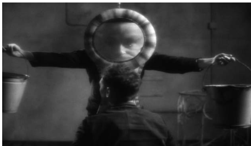
Institut Benjamin (S. Quay et T. Quay, 1995). Illustrations : Zeitgeist Films. © Koninck Studio Ltd.

énonce les chiffres écrits au tableau qui enjoignent les élèves à réciter leur leçon, et ses mots, comme ceux avec lesquels il a accueilli Jakob, ont une sonorité telle qu'ils semblent émis par une autre voix.