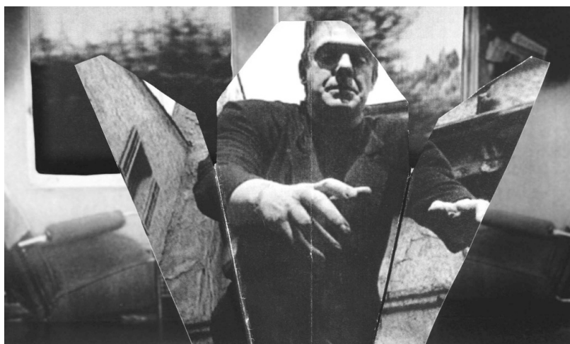
Fast Film , Virgil Widrich (2003)

tion de l'identité y est posée avec force : d'une part à travers le travail d'identification des images exigé en permanence, d'autre part à travers la crise d'identification du spectateur qui ne cesse de chercher sa place (les acteurs ne cessent de se substituer les uns aux autres, créant par là un important effet d'instabilité).