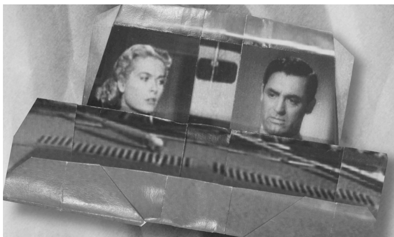
Fast Film , Virgil Widrich (2003)

ombre apparaît, reconnaissable entre mille : Humphrey Bogart. Il pousse une porte, découvre Lauren Bacall, mais il y a un faux raccord. Humphrey n'est plus habillé de la même manière. Il va d'ailleurs continuer à se substituer à lui-même, dans d'autres costumes et à d'autres âges. Lauren également est remplacée soit par elle-même, soit par d'autres actrices. Ils échangent un baiser, la position reste la même, les protagonistes changent. La texture de l'image est curieuse. Il s'agit de papier en fait, qui tremble et se met à se déchirer. Un horrible bruit de train. L'image se plie sur elle-même ; l'héroïne est faite prisonnière et se trouve enfermée dans un sarcophage composé d'images cinématographiques, certaines en couleurs, d'autres non, certaines visiblement contemporaines, d'autres très datées. Les images pliées forment un petit wagon qui s'en va sur un décor de western. Le film joue sur plusieurs dimensions et multiplie les surfaces. Un cheval de papier, calquant les postures de sa course sur les célèbres photographies de Muybridge, prend en charge Bogart. Une chaotique remontée du train en course folle commence. Les adversaires se multiplient, chaque wagon devenant une surface cinématographique pour cow-boys, monstres et autres personnages égarés. Le héros saute dans le train, se transforme en Tarzan, puis en pirate, avant de prendre encore les traits de Harrison Ford dans Indiana Jones . La