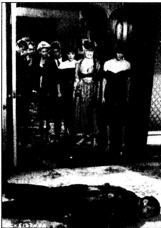
Clue (Jonathan Lynn, 1985)

celle d'élucider le crime. Les questions que le jeu leur impose : qui ? où ? comment ? Les joueurs doivent démasquer le meurtrier parmi six personnages possibles, déterminer l'instrument du crime parmi six armes possibles et découvrir le lieu du crime. Le tableau de jeu consiste en un plan de la demeure de la victime et chaque joueur déplace son pion de manière à pénétrer dans l'une ou l'autre des neuf pièces, l'accès à une pièce lui conférant le droit de mener son enquête par un jeu de questions et de réponses, plutôt simples, de l'ordre de la déduction. La partie prend fin, évidemment, lorsqu'un joueur peut lever le voile sur les circonstances du meurtre 5 .