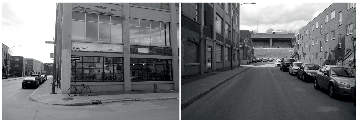
FIGURE 2 L'environnement de proximité du Tableau Blanc | Conception : Parent-Frenette, 2017 (visites de terrain) Adaptée par le Département de géographie de l'Université Laval, 2019