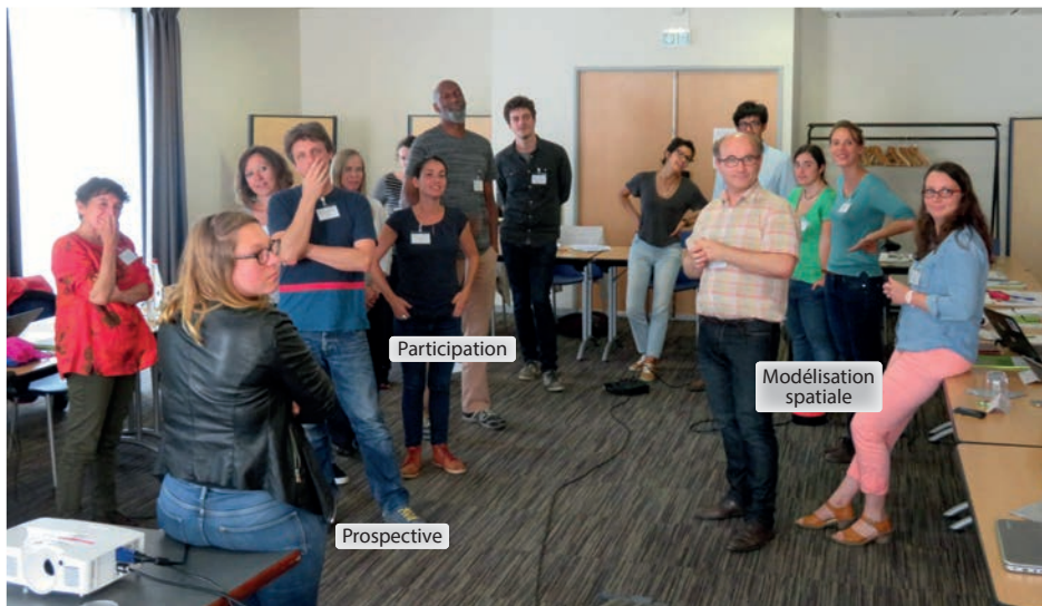
Figure 1 Positionnement des participants dans le triangle « prospective, participation et modélisation spatiale »

Lors de la première demi-journée, après une courte introduction sur l'historique de l'école et les objectifs visés, les participants ont été invités à se positionner physiquement dans un triangle « prospective, participation et modélisation spatiale » matérialisé dans la salle tout en explicitant le pourquoi de ce positionnement (figure 1). Dans la foulée, un cadrage théorique et méthodologique des trois domaines et de l'intérêt de leur combinaison pour répondre aux enjeux d'une gestion durable des ressources dans un territoire a été mis en débat. Puis, une grille d'analyse des approches de prospective participative basée sur la modélisation spatiale a été proposée comme support de réflexion. Enfin, une séquence apéritive de présentation interactive des projets des participants par des mini-affiches a clôturé la journée (figure 2).