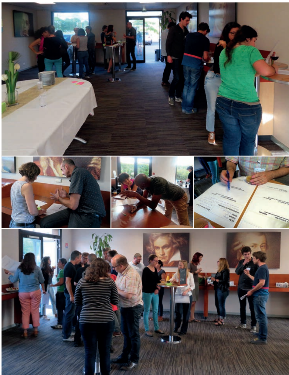
Figure 2 Des participants en interactions autour de leurs projets de recherche