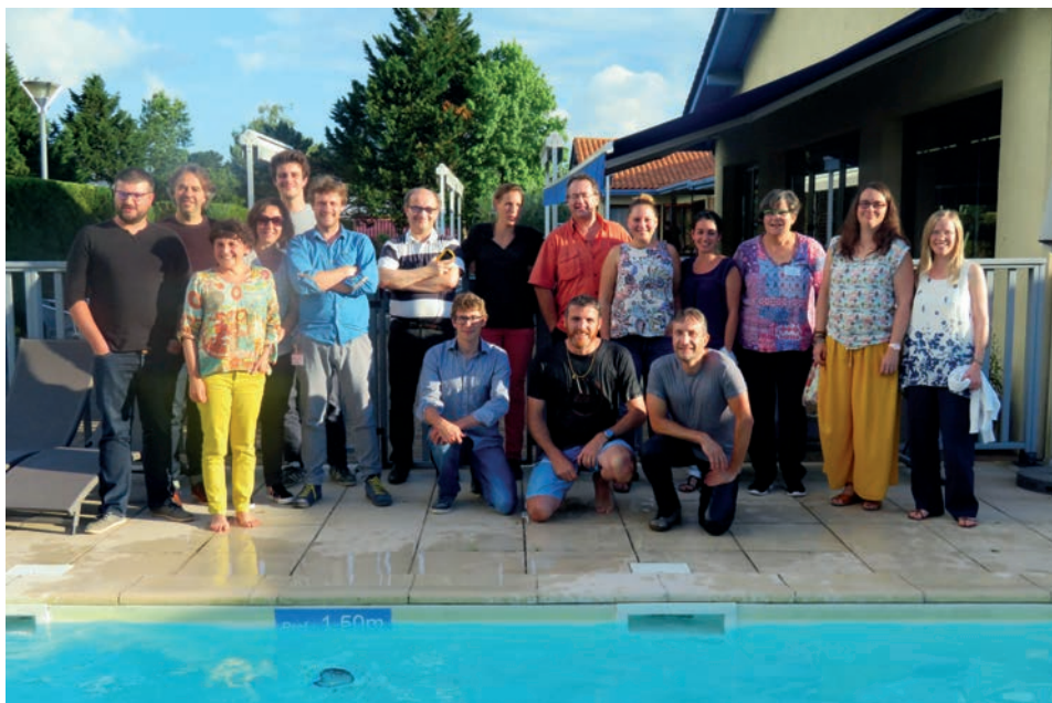
Figure 4 Photo de groupe (incomplet)