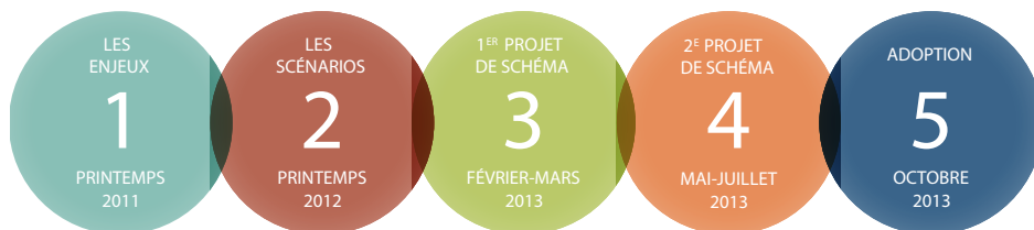
Figure 2 Les étapes du processus de révision du SAD

Le processus de révision du SAD, résumé dans la figure 2, s'est articulé autour d'un vaste processus de consultation publique en quatre étapes, sous le thème « Aménageons le futur ! » et pour lequel une variété de dispositifs participatifs a été mobilisée pour permettre aux citoyens de se prononcer tout au long de l'avancement du projet.