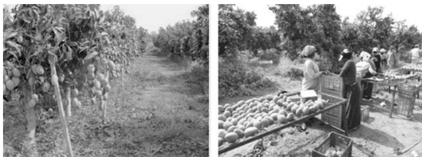
Figure 4 Récolte de mangues dans le périmètre agro-industriel de SAFINA, Sébikhotane, juillet 2015