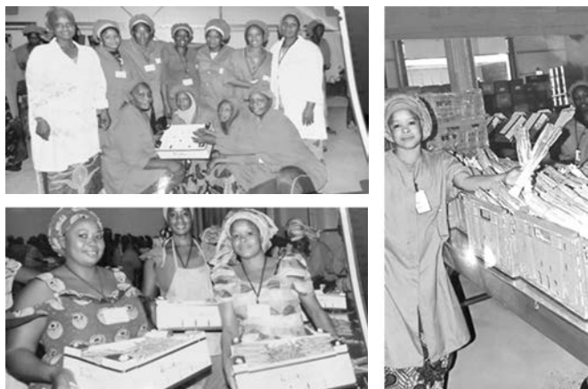
Figure 5 Les femmes trieuses du périmètre maraîcher de Van Oers, février 2017

Source: Ngom, Badiane, Diongue et Mbaye, 2015