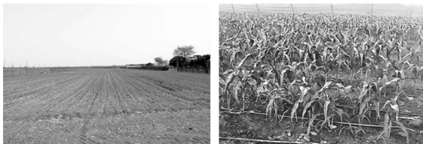
Figure 3 Culture de maïs doux dans le périmètre agro-industriel de Van Oers, Kirène, juillet 2015